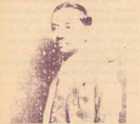
สำนักหอสมุดกลาง ม.ร. "สายป่าน"