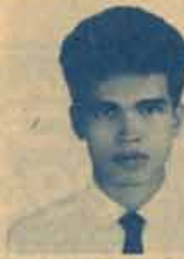
นายอดิษฐ์ นุ่นดูช พรทดกระทอควรม