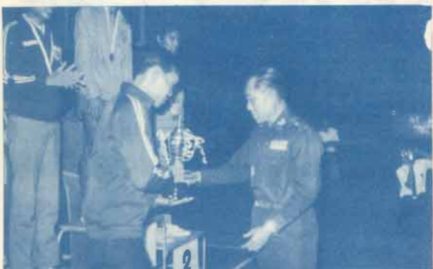
18 ม.ค. 15 ทีมตะกร้อ ม.ร. รั้งถ้วยชนะเลิศ จากมือเลขาธิการสมาคมกีฬาไทย ณ โรงแรม 27 กีฬาสถานแห่งชาติ