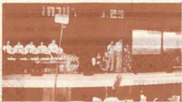
พิธีออกรางวัลสลากกาชาด ม.ว.