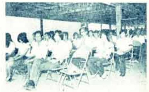
ภาพและข่าวโดย ดินสุข สุคนธ์อำรุง น.ร.