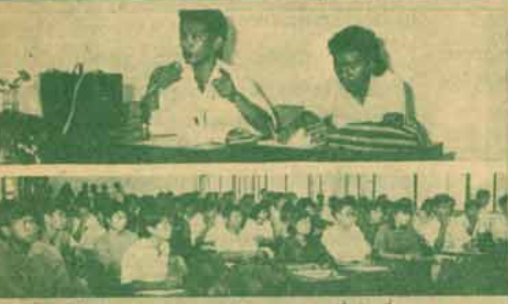
เตรียมจัดสรรงบประมาณ 1 ถึงกรวม เมื่อวันที่ 20 เมษายน 2531 ณ ห้องประชุมสภานักศึกษา ตึกกิจกรรมนักศึกษา ชั้น 2 มีการประชุมผู้แทนชมรมต่าง ๆ ที่สังกัดองค์กรนักศึกษา เพื่อหารือเกี่ยวกับการเตรียมจัดสรรงบประมาณกิจกรรมนักศึกษา ประจำปีการศึกษา 2531 ตามรายละเอียดใน "ข่าวรวมคำแถลง" ฉบับนี้

จัดสรรงบประมาณ ☆ ต่อจากหน้า 1 ประจำปี โดยจัดสรรงบประมาณให้กับส่วนต่างๆ แล้วเสนอต่อสภานักศึกษาเพื่อเห็นชอบ" และ "ให้คณะกรรมการชมรมกำหนดนโยบาย โครงการ และงบประมาณประจำปีของชมรมเสนอต่อคณะกรรมการองค์การนักศึกษาให้เสร็จสิ้นก่อนวันเปิดภาคเรียนภาคแรกเป็นเวลาสามวัน" ดังนั้น จึงขอให้ชมรมต่างๆ ดำเนินการส่งโครงการและงบประมาณของชมรมโดยด่วน พร้อมทั้งขอให้ส่งวัตถุประสงค์ของชมรม และนโยบายของคณะกรรมการชมรมที่ได้รับบริหารชมรมเพื่อดำเนินการให้เป็นไปตามวัตถุประสงค์ของชมรม มาให้คณะกรรมการองค์การนักศึกษาพิจารณาด้วย