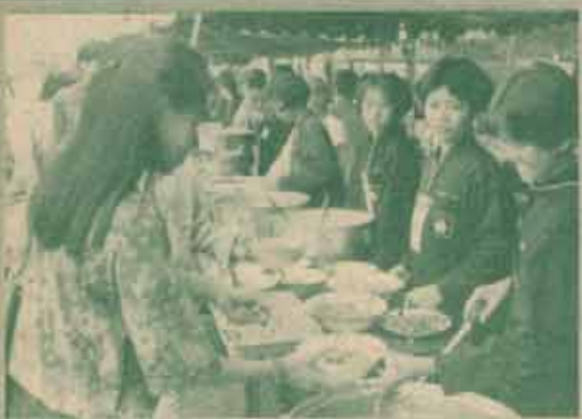
รามบุษอาสาพาหะ นักศึกษากลุ่มรามบุษฯธรรม จัดงานนิทรรศการด้านพระพุทธศาสนา ในหัวข้อ 'รามบุษอาสาพาหะ' ครั้งที่ 15 ระหว่างวันที่ 5-7 กรกฎาคม 2538 ณ บริเวณหอประชุม เอ.ดี. 1 ได้ศึกษาดูงานและบริเวณพระรูปที่อนุสรณ์รามคำแหงภายในงานได้จัดเลี้ยงอาหาร บัณฑิตวิทยาลัย