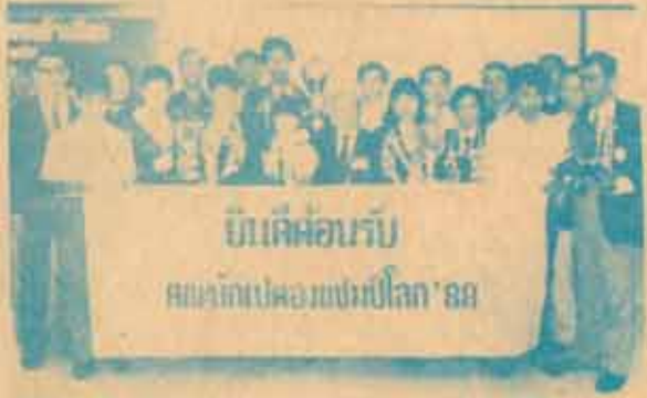
ยินดีต้อนรับ