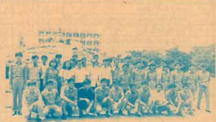
สักการะพุ่มพวง บัณฑิตคณะรัฐศาสตร์ และคณะนิติศาสตร์ ม.ร. ซึ่งสอบแข่งขันเป็นปลัดอำเภอและผู้ช่วยนายทะเบียน รุ่นที่ 6 จำนวน 62 คน ได้มาสักการะพุ่มพวง เพื่อความเป็นสิริมงคลก่อนออกไปปฏิบัติหน้าที่ พร้อมทั้งเข้าพบและรับโอวาทจากคณาจารย์คณะรัฐศาสตร์ เมื่อวันที่ 14 ตุลาคม 2531