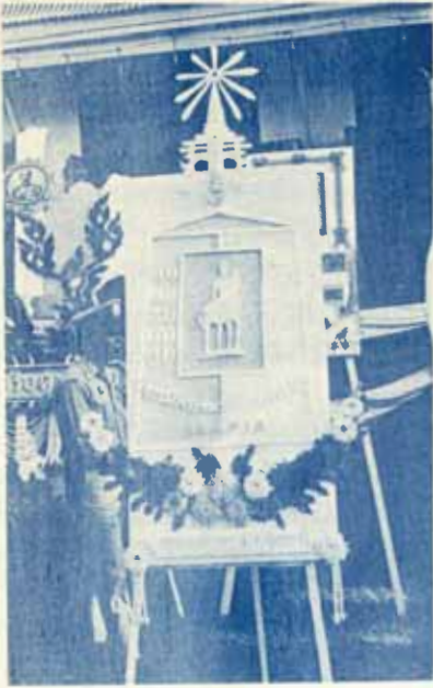
คณะนักศึกษามหาวิทยาลัยรามคำแหง ณ จังหวัดอุดรธานี วางพวงมาลาถวายสักการะ แด่สมเด็จพระปรมินทรมหาฯ ๒๓ ต.ค. ๒๕