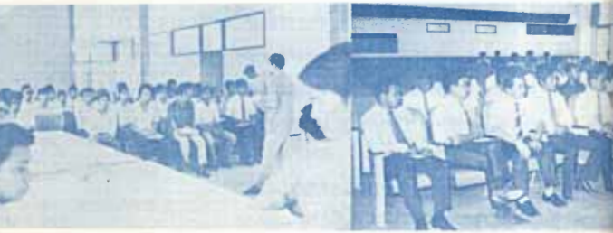
คณะกรรมการ อสมร. ทำเป็นการประชุมเพื่อร่วมทบทวนกิจกรรมงาน