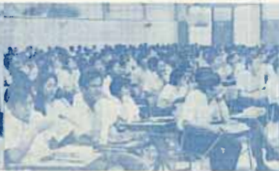
วาม.ร. ฟังใจฟังอย่างตั้งใจ