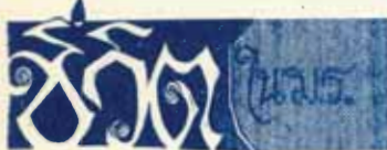
ภาพโดย นายวิเชียร อินทพหิม นศ.ม.ร. นายอิทธิพล ศรีเสาวลักษณ์ นศ.นศ.