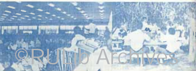
ชมรมว้าง เรามีกิจกรรมกีฬา คนรัก และ