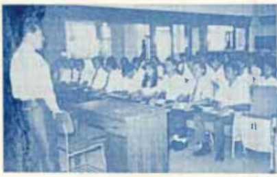
ทำนอธิการบดี คุณเอาใจใส่ปฏิบัติงานของ อสมร. อย่างใกล้ชิด