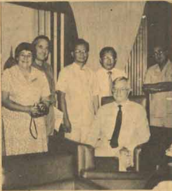
ผู้แทน นว. เมื่อวันที่ 27 กรกฎาคม 2527 คณะอาจารย์จากมหาวิทยาลัยนิวเจอร์ซีย์ และมหาวิทยาลัยชิคาโก จากสหรัฐอเมริกา และมหาวิทยาลัยวิกตอเรียจากประเทศออสเตรเลีย ได้มาพบปะผู้บริหารมหาวิทยาลัยรามคำแหง เพื่อพิจารณาเกี่ยวกับความร่วมมือกันทางวิชาการและโอกาสเชิญชมกิจการของมหาวิทยาลัยด้วย