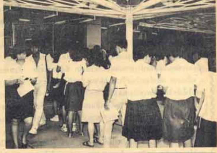
ลงทะเบียนเรียน นักศึกษาเก่ามาลงทะเบียนเรียน ภาค 1/2527 ที่มหาวิทยาลัยเป็นวันแรก เมื่อวันที่ ๒ สิงหาคม 2527 การลงทะเบียนภาค 1/2527 จะมีจนถึงวันที่ 17 สิงหาคม 2527

คามที่มหาวิทยาลัยรามคำแหงมีนโยบายเทียบโอนหน่วยกิตแก่ผู้สมัครที่มีคุณวุฒิปริญญา ปริญญา หรือประกาศนียบัตรสูงกว่าประโยคมัธยมศึกษาตอนปลาย จากมหาวิทยาลัยรามคำแหง หรือสถาบันอุดมศึกษาอื่น ซึ่งมหาวิทยาลัยรามคำแหงรับรอง ซึ่งได้ให้สิทธิแก่นักศึกษาเก่าที่สมัครเข้าศึกษาตั้งแต่ปีการศึกษา 2519 - ปีการศึกษา 2526 ด้วย โดยกำหนดให้นักศึกษาเหล่านี้ไปแสดงความจำนงขอเทียบโอนหน่วยกิตกับคณะที่นักศึกษาศึกษาอยู่ ภายในวันที่ 28 ธันวาคม 2526 นั้น อ่านต่อหน้า 12