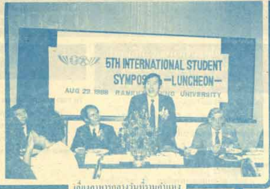
โต๊ะอาหารกลางวันร่วมกันกับแขก