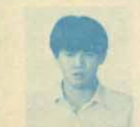
นายวราวุฒ แฉงเจน หัวหน้าพรรคทศธรรม