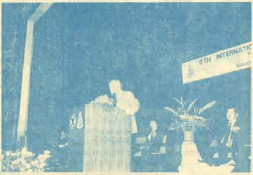
พิธีเปิดการประชุม ณ มหาวิทยาลัยธรรมศาสตร์