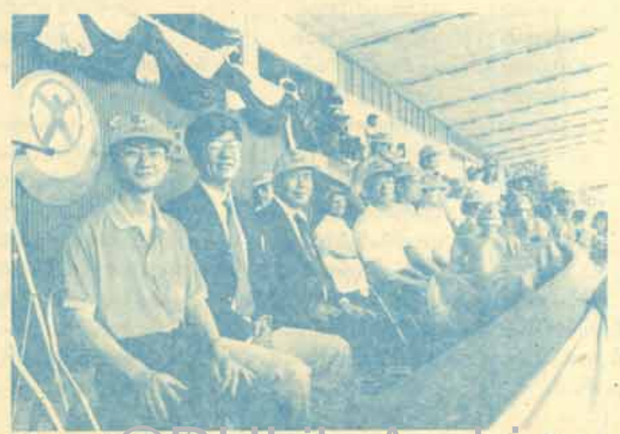
พิธีปิดการแข่งขันกีฬานานาชาติ