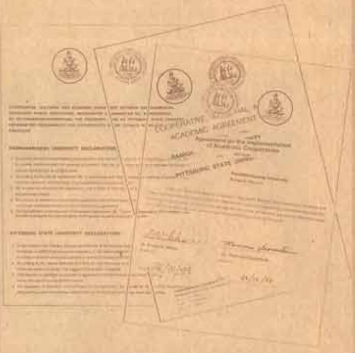
ภาพและข่าวโดยประไพภรณ์ ศรีมว.

สัญญาความร่วมมือ ม.ร. - PSU ที่เห็นอยู่นี้คือ สัญญาความร่วมมือทางด้านเทคนิคและวิชาการระหว่าง มหาวิทยาลัยรามคำแหง และ Pittsburg State University (PSU) ซึ่งอธิการบดี 2 สถาบัน เป็นผู้ลงนาม เมื่อวันที่ 26 ตุลาคม 2531 ตามรายละเอียดใน "ข่าวรวมแล้ว" ฉบับนี้