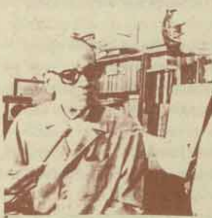
นากิบ มาฟูซ นักเขียนชาวอียิปต์ที่ได้รับรางวัลโนเบลสาขาวรรณคดีในปี 2531

แม้มากิบ มาฟูซจะเป็นชื่อที่ค่อนข้างใหม่ต่อผู้สนใจวรรณกรรมโดยทั่วไป แต่เขามีชื่อเสียงมากในประเทศของเขา เขาได้ชื่อว่าเป็นบิดาของวรรณกรรมอาหรับสมัยใหม่ เป็นนักคิดอิสระ และเป็นผู้ท้าทายต่อเรื่องราวของมนุษย์ที่ค้นหาคุณค่าของชีวิต