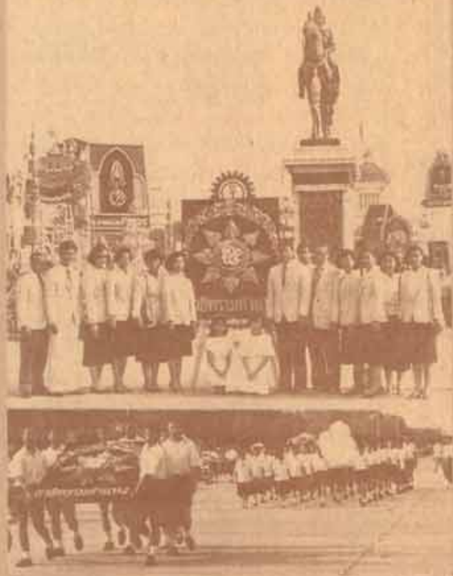
ธวัชบังคม คณะครูฯ นักเรียน และวงโยชวาทศโรงเรียน สาธิตมหาวิทยาลัยรามคำแหง นำพวงมาลาถวายเป็นราชสักการะพระ บรมรูปพระบาทสมเด็จพระจุลจอมเกล้าเจ้าอยู่หัว ณ บริเวณพระ บรมรูปทรงม้า เนื่องในวันปิยมหาราช เมื่อ 23 ตุลาคม 2531