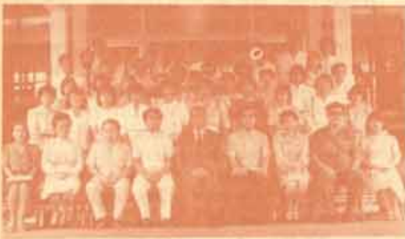
นักประชาสัมพันธ์ ศูนย์ปฏิบัติโรงานการประชาสัมพันธ์ จากหน่วยงานต่าง ๆ ของมหาวิทยาลัย จำนวน 40 คน ที่เข้ารับการอบรมหลักสูตรเจ้าหน้าที่ประชาสัมพันธ์ ของมหาวิททยาลัยจายโรงเรียนการประชาสัมพันธ์ ระหว่างวันที่ 15-17 พฤศจิกายน 2527 วัณมอบวุฒิปัตวจาก นายสมนึก ศรีอับนโย อธิบดีกรมประชาสัมพันธ์ เมื่อวันที่ 29 พฤศจิกายน 2527 ณ โรงเรียนการประชาสัมพันธ์ ซอยฮอเวี 4