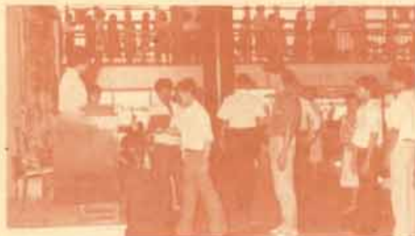
ฝึกซ้อม มัคคุเทศน์มหาวิทยาลัยรามคำแหง วันที่ 10 ดำเนินการฝึกซ้อมการรับพระราชทานปริญญาบัตร ครั้งที่ 1 ระหว่างวันที่ 10-18 ธันวาคม 2527 ณ ศาลาไทยเกษมสันต์