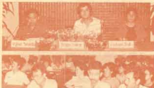
ตั้งแถว สำนักงานอธิการบดี น.ร. จัดการสัมมนา เรื่อง "แนวทางการดำเนินงานของสำนักงานอธิการบดี" เมื่อวันที่ 7-9 ธันวาคม 2527 ณ ห้องประชุม คณะนิติศาสตร์ ชั้น 3 และโรงแรมพัทยาทองสุข เมืองพัทยา จังหวัดชลบุรี