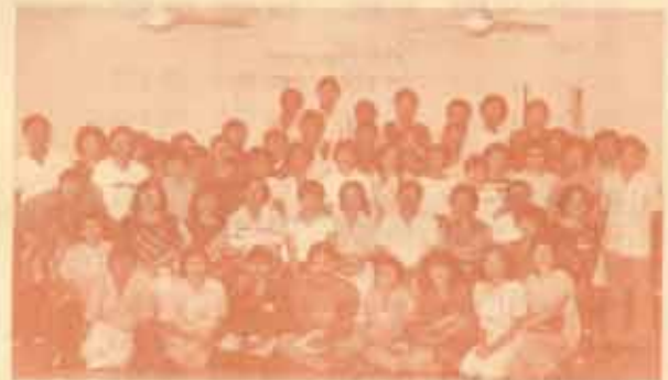
อบรมลัทธิคณะกรรมาธิการแนวของ สวป. ร่วมกับคณาจารย์ ภาควิชาศึคศึกษา คณะศึกษาศาสตร์ จัดโครงการอบรมเชิงปฏิบัติการ เรื่อง "การปรับปรุงการให้บริการแนะแนว" แก่ นักแนะแนวของ สวป. และหน่วยงานต่าง ๆ ใน น.ร. จำนวน 60 คน เมื่อวันที่ 18-19 พฤศจิกายน 2527 ณ ศูนย์ฝึกอบรม มหาวิทยาลัยเกษตรศาสตร์ ส่วนผสมผสาน จ.นครปฐม การฝึกอบรมครั้งนี้ ประสบผลสำเร็จเป็นอย่างดี