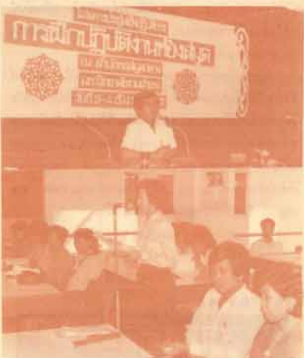
ฝึกปฏิบัติโรงตลกโองสมุค วท.ศุขุม นวลตฤถ อธิการบดี มหาวิทยาลัยรามคำแหง เป็นประธานเปิดการประชุมปฏิบัติกร เรื่อง "การฝึกปฏิบัติโรงตลกโองสมุค" ณ สำนักหอสมุดกลาง ชั้น 3 เมื่อวันที่ 4 ธันวาคม 2527