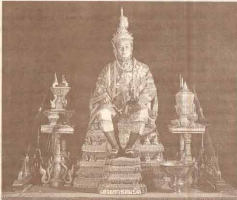
เสด็จมาสมมติ

จศ. กิจยสุนทร อธิบดีกรม หอจิวราฐานุสรณ์ : เนื้อเพื่อภาพ