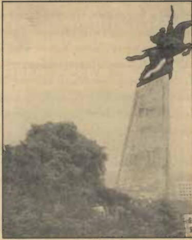
อนุสาวรีย์แม่ป๋าน สัญลักษณ์ของการพัฒนาเศรษฐกิจแบบก้าวกระโดด