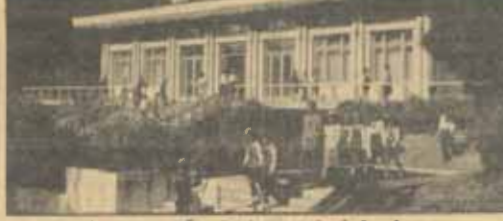
มัน ของ เค บ้านเกิดประธานาธิบดี คิม อิล ซุง

วันที่ 10 ก.ย. เราได้ไปชม โรงพยาบาลแม่ (Maternity Hospital) ซึ่งชำนาญเป็นพิเศษทางด้านสูติกรรม (ออกลูก) เป็นตึกสูง 13 ชั้นมี 1,500 เตียง มีเครื่องมือทันสมัย ที่ชอบใจกันคือพวกเขาต้องถอดรองเท้า ใส่รองเท้าแตะและเสื้อกาวด์แบบหมอบของโรงพยาบาลพวกญาติคนใจจะไปใส่ให้เขาไปเยี่ยมกันแบบบ้านเราไม่ได้ เขาจัดเวลาให้เยี่ยมญาติทางทีวี มีห้องที่จัดทีวี และไมโครโฟนให้ญาติได้ตอบกันเวลาพูดจะเห็นหน้ากันที่ท่าเช่นนี้เพื่อป้องกันเชื้อโรคติดสารกัมมันตรังสี ส่วนห้องพักคนไข้ นอกจากห้องเดี่ยว ยังมีห้องรวม 2, 3, 5 คน และห้องรวมแยกตามลักษณะโรค ห้องเด็กแรกเกิดต้องเลี้ยงจนกระทั่งเด็ก