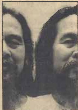
ช่าง แซ่ตั้ง, ขามเข่า, กรุงเทพฯ ๑: หอศิลป์กวีช่าง แซ่ตั้ง, 2528 ภาพประกอบ 45 บาท

“ขามเข่า” เป็นบทกวีบางบทของ “บทกวีพอกับแม่” ระหว่างปี พ.ศ. 2509-2514 ของช่าง แซ่ตั้ง ซึ่งเป็นบทกวีที่แสดง ให้เห็นถึงหลักปรัชญาแห่งชีวิต ระหว่างความเป็นพ่อ แม่ ลูก ซึ่งมีความลึกซึ้งและความมีคุณค่าของความเป็น พ่อ แม่ ลูก กัน ซึ่งจะสะท้อนให้เห็นถึงความสัมพันธ์ระหว่างมนุษย์กับธรรมชาติ อันเป็นหลักสังขธรรมแห่งชีวิต ตั้งแต่เกิดจนกระทั่งตาย “ขามเข่า” นับว่าเป็นบทกวีที่หาคำมิได้ แห่งวงการ วรรณกรรมแห่งบทกวีอีกเล่มหนึ่ง โดยเฉพาะผู้ติดตามผลงาน ของช่าง แซ่ตั้ง มาแล้ว ท่านควรได้สัมผัสกับบทกวีแห่ง “ขาม เข่า”