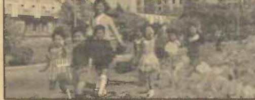
ภาพเด็กนักเรียนกำลังเดินทางไปโรงเรียน

มี น.น. 4 ก.ก.จึงจะให้ออกจากห้องเลี้ยงทารกหลังคลอดได้ ถ้าใครมีลูกแฝดจะได้ของขวัญจากท่านประธานาธิบดี มีผู้ทำสถิติแฝดสูงสุดคือแฝด 4 คน มีชีวิตรอดทุกคน เรื่องผู้ป่วยนั้นเราสงสัยว่าคนไข้ทำไมไม่แน่นเหมือนบ้านเรา เขาบอกว่า เขาแม่คน และโรงพยาบาลเป็นโซน คนที่อยู่ในเขตโรงพยาบาลคือ ให้ไปตรวจรักษาที่โรงพยาบาลนั้น ไม่ให้มารักษาข้ามโซน ยกเว้นคนไข้ที่ได้รับการแนะนำจากหมอที่เป็นเจ้าของไข้ให้มารักษาต่อ จึงจะเปลี่ยนโรงพยาบาลได้ หลังจากนั้นได้ไปชม หอสมุดแห่งชาติเกาหลี (Central Library) เป็นอาคารใหญ่สง่าเป็นศิลปะแบบเกาหลี มีหนังสือ 16 ล้านเล่มมีห้องรวม 800 ห้อง มีที่อ่านหนังสือ 5,000 ที่นั่ง และมีผู้ใช้ห้องสมุด 5,000 - 6,000 คนต่อวัน เปิดตั้งแต่ 8.00 - 22.00 น. การขยืมหนังสือเขามีวิธีการแปลกกว่าบ้านเราคือ ให้ผู้ยืมจดรหัสหนังสือจากตู้บัตรรายการส่งแก่เจ้าหน้าที่ ๆ จะเคาะคอมพิวเตอร์แจ้ง สักครู่ก็มีหนังสือนั้นใส่กล่อง แล่นมาตามราง (คงมีคนจัดให้อยู่ตามรังต่าง ๆ) นอกจากนี้ยังมีห้องฝึกภาษา (Sound lab) ทั้ง ห้องเรียนดนตรีและวิดีโอ รวมทั้งห้องประชุม, ห้องบรรยายที่มีระบบโทรทัศน์วงจรปิด ขนาดจุประมาณ 100 - 200 คน ตอนบ่ายได้ไปเยี่ยม