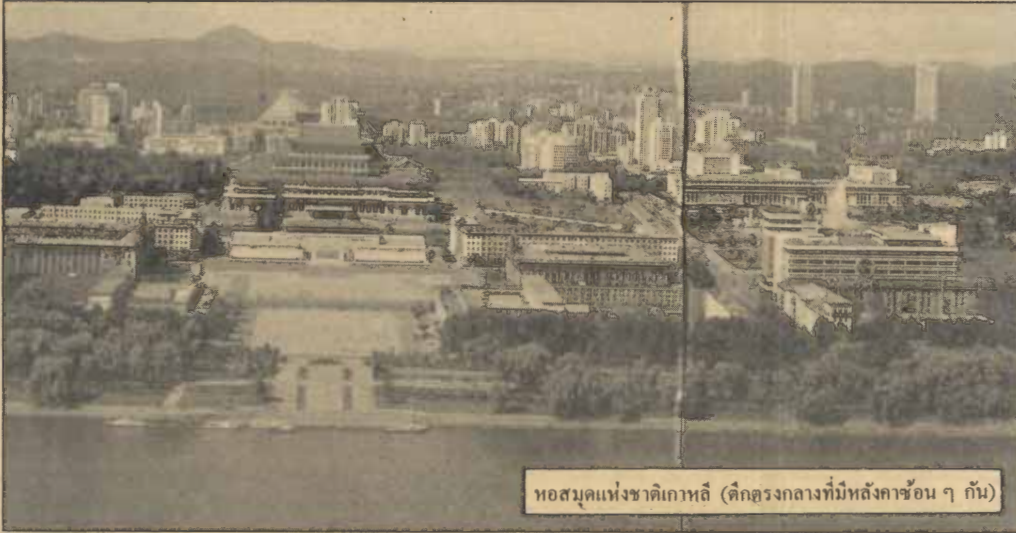
หอสมุดแห่งชาติเกาหลี (ตึกตรงกลางที่มีหลังคาซ้อน ๆ กัน)

แสดงของเด็กโต ๆ ทำให้ไม่แปลกใจเมื่อรู้ว่าเกาหลีมีแชมป์โลก อิมนาสติกอยู่หลายคน ถ้าฝึกกันตั้งแต่เด็ก ๆ พื้นฐานจะดีและเก่งกว่าที่จะฝึกคอนโด ๆ (อยากให้ผู้รับผิดชอบเรื่องกีฬาบ้านเรามาดูงานบ้างจะได้พัฒนากีฬาของเรอย่างจริงจัง ของเขานั้นถ้าเป็นพวกที่เล่นกีฬาเก่ง ไม่ต้องห่วงเรื่องการเรียน เขาจะจัดครูพิเศษตัวให้ต่างหาก และเกียรติยศของนักกีฬาที่ชนะการแข่งขันระดับประเทศแล้วจะได้รับยกย่องอย่างวิจิตรบรรจงถือว่าได้ชื่อเสียงแก่ประเทศชาติ) เคล็ดลับในการแปรอักษรให้ได้นั้นเขาแยกเป็นหลายโรงเรียน และแต่ละแห่งจะแยกได้ค้ไปซ้อมแปรอักษรทุกวัน รูปภาพที่แปรออกมาจึงสวยงาม และพร้อมเพรียง บางทีใช้ไม้ค้วงตะลูกบอล จนเข้าประตูก็มี เกาหลีมีนโยบายพัฒนาเยาวชนด้วย การศึกษา การกีฬา และดนตรี การพัฒนากีฬาโดยส่งเสริมการเล่นอิมนาสติกเป็นหลัก นอกจากนี้จะเป็นการคัดคนเก่งไว้แข่งขันกับชาติอื่น ๆ แล้วยังช่วยให้เด็กเขาแข็งแรงและมีระเบียบวินัย เด็กผู้หญิงเกาหลีดูแข็งแรงมาก เวลาจะเดินไปโรงเรียนจะเดินเป็นแถว เข้มแข็งกับเด็กผู้ชาย เด็กผู้หญิงนิยมติดโบว์เป็นกลุ่มไว้บนศีรษะ แต่หากลสักัน พอโตขึ้นก็ไว้ผมแบบธรรมชาติ