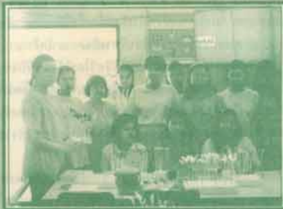
สวัสดิการทำขนม งานกิจการและนิสิตนักศึกษาจัดอบรมสวัสดิการทำขนมลูกพ่อขุนฯเมื่อวันที่ ๑๖ มกราคม ๒๕๔๒ ณ วิทยาลัยนวมินทราชูทิศ โดยมีผู้สนใจเข้าร่วมอบรมจำนวนรวม