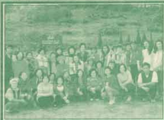
ทัศนศึกษา สวัสดิการมหาวิทยาลัยรามคำแหงจัดทัศนศึกษานักอาจารย์ ข้าราชการของ ม.ร. เมื่อวันที่ ๗-๑๓ มกราคม ๒๕๔๒ ณ อุทยานฯ หอสมุดฯ หอสมุดฯ อำเภอแม่สาย บริเวณสามก่อกองของลำ จังหวัดเชียงราย โดยมีบุคลากรเข้าร่วมโครงการ ๔๑ คน