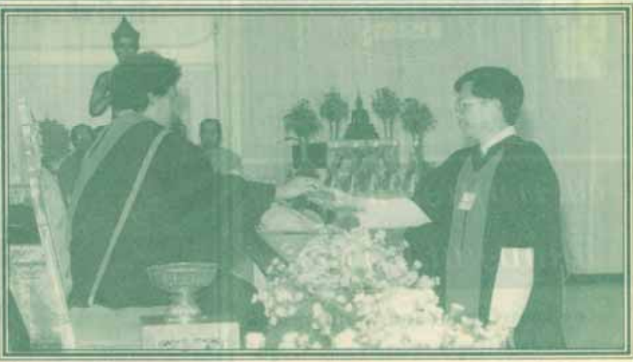
สมเด็จพระเทพรัตนราชสุดาฯ สยามบรมราชกุมารี พระราชทานเหรียญพ่อขุนฯทองคำแก่ รองศาสตราจารย์ ดร.อภิชาติ สุขสำราญ อาจารย์คณะวิทยาศาสตร์ ม.ร. ในงานพิธีพระราชทานปริญญาบัตรของมหาวิทยาลัยรวมค้ำแหง เมื่อวันที่ 25 มกราคม 2542 ณ อาคารหอประชุมพ่อขุนรามคำแหงมหาราช (อ่านต่อหน้า 11)