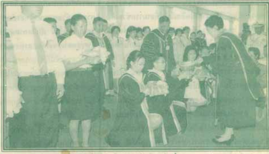
คณะกรรมการบัณฑิต มหาวิทยาลัยรวมค้ำแหง วันที่ 24 กุฎเกล้าฯ ถวายเงิน จำนวน 544,444.44 บาท แก่สมเด็จพระเทพรัตนราชสุดาฯ สยามบรมราชกุมารี ในงานพิธีพระราชทานปริญญาบัตร เมื่อวันที่ 27 มกราคม 2542 ณ อาคารหอประชุมพ่อขุนรามคำแหง