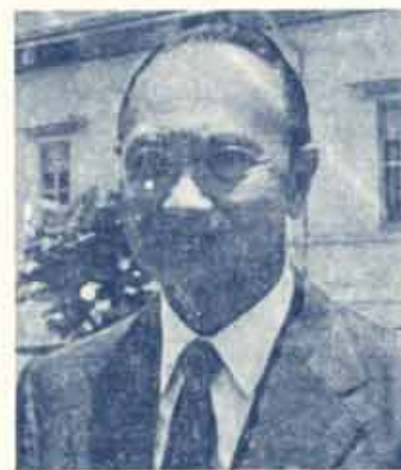
ศาสตราจารย์ ยวุน ฮวเทกนี

เมื่อวันที่ ๑๙ พฤศจิกายน ๒๕๑๖ เวลาประมาณ ๑๔.๐๐ น. ฯพณฯ รมต. ว่าการทบวงมหาวิทยาลัยของรัฐ ท่านปลัดทบวงฯ และเลขาธิการรัฐมนตรีได้นำเยี่ยม ม. การมาครั้งนี้เพื่อพบปะกับคณะผู้บริหารของมหา วิทยาลัยรามคำแหง ในการนี้ ฯพณฯ รมต. และคณะได้รับ ทราบข้อปัญหาของมหาวิทยาลัย และพิจารณาแนว ทางแห่งความร่วมมือระหว่างมหาวิทยาลัย และทบวงฯ ได้ มีการพูดคุยถึงปัญหาการเรียนซึ่งจะไม่เพียงพอกับจำนวน นักศึกษาในอนาคตอันใกล้ การให้ความร่วมมือกับ นักศึกษาในการชำระหนี้และเผยแพร่รัฐธรรมนูญ และเรื่อง อื่นๆ ที่เกี่ยวกับมหาวิทยาลัยรามคำแหง การประสานงาน กับมหาวิทยาลัยอื่น และทบวงด้วย