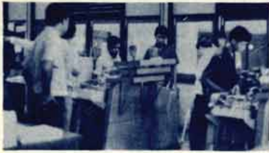
ภายในโรงพิมพ์

โรงพิมพ์ ม.ร. แจ้งว่า โรงพิมพ์จะขยายงานด้านการพิมพ์โดยได้ติดต่อซื้อแท่นพิมพ์ ออฟเซต ขนาดสัก ๒ ซึ่งจะสามารถจัดพิมพ์ ขร. ได้ทันทีกำหนด สมาชิก ขร. จะได้รับข่าวรวมค่าแห่งเร็วขึ้น