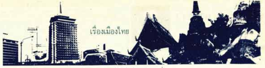
ขอเชิญชาวต่างประเทศศึกษา น.ร. ทุกท่านร่วมเขียนบทความสั้น ๆ เกี่ยวกับเมืองไทย โดยมีจุดมุ่งหมายส่งเสริมความรู้อันดีของเมืองไทย ทั้งชีวิตประจำวัน ชาติ ศาสนา วัฒนธรรม ประวัติศาสตร์ ภูมิศาสตร์ ฯลฯ ตลอดจนวิถีชีวิตอันดี ที่เป็นอันควรเชื่อถือได้

แนวทางที่พึงปรารถนา ทุกสังคมจะกำหนดค่านิยมและบรรทัดฐานของสังคมไว้เพื่อเป็นแนวทางให้สมาชิกปฏิบัติตาม เป้าหมายที่สำคัญยิ่งของการตั้งค่านิยมของสังคมนี้ เพื่อที่จะให้ความสัมพันธ์ของคนเป็นไปอย่างมั่นคงและมีระเบียบแบบแผนการที่สังคมมอบให้สมาชิกเคารพคอกฎหมายบ้านเมือง ประกอบสัมมาอาชีพในทางสุจริต และสามัคคีร่วมกันภายในชาติ ก็เพื่อให้สังคมอยู่ได้อย่างสงบ แต่ละคนก็จะมิบทบาทในทางสนับสนุนเกื้อกูลให้ค่านิยมนี้คงอยู่ หากเมื่อใดสมาชิกบางคนมีพฤติกรรมผิดค่านิยมนี้ ก็จะได้รับโทษ เช่น ว่ากล่าวตักเตือน ไม่ให้ความเคารพนับถือหรือจำคุกก็ยังมี แล้วแต่ความรุนแรงของการกระทำ