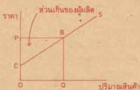
แสดงส่วนเกินของผู้ผลิต

ส่วนเกินของผู้ผลิต คือ พื้นที่ส่วนที่เหลือขึ้นไปจาก เส้น supply ภายใต้อัตราราคา P ณ ระดับปริมาณสินค้า O อธิบายได้ดังรูปที่ 2