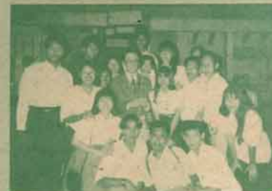
สูงาน ศูนย์นักศึกษานิสิตรวม มหาวิทยาลัยราม คำแหง นักศึกษาเข้าร่วมขั้นตอนการดำเนินงานสถานี โทรทัศน์กองทัพบก ช่อง 7 และวาทกรรมรุ่นสนศาว เมื่อวันที่ 12 กุมภาพันธ์ 2534 ได้รับการต้อนรับจากทาง สถานี ฯ เป็นอย่างดี