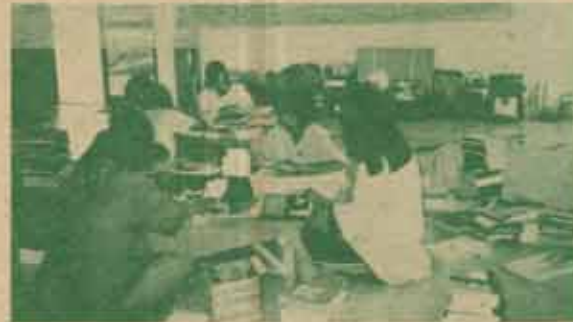
นักศึกษาภาควิชาบรรณารักษศาสตร์ กำลังจัดระบบหนังสือในห้องสมุด

เริ่มเรียนในปีการศึกษา 2533 มีนักเรียน 298 คน แต่สำหรับอาคารห้องสมุด ทรงรับสั่งว่าจัดสร้างให้คงทนถาวร เป็นอาคารก่ออิฐถือปูน ขณะที่อาคารห้องสมุดกำลังก่อสร้าง ก็ทรงหาหนังสือเตรียมไว้พระราชทานแก่ห้องสมุดประมาณ 2,000 เล่ม จากนั้นมีบุคคลต่างๆ นำหนังสือขึ้นทูลเกล้าฯ ถวาย ทั้งที่เป็นเทพพร ชีรชกกร นิสิต บริญญุกโท บริญญุกเอก