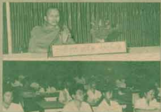
เปิดนิมิตภท คณะวิทยาศาสตร์จัดโครงการปฐมนิเทศ นิเทศนักศึกษาปีสุดท้าย ปีการศึกษา 2533 เมื่อวันที่ 13 กุมภาพันธ์ 2534 ณ ห้องประชุมคณะนิติศาสตร์ ชั้น 3 โดยได้เชิญพระพรหม กัลยาณิวัฒนา มาแสดงปาฐกถาธรรม ด้วย

กิจกรรมภาษาอังกฤษ ค่าลงทะเบียน 2,000 บาท กิจกรรมศิลปะ วาดภาพ ศิลปะประดิษฐ์ กำหนดรับสมัครวันที่ 5-7 กิจกรรมภาษาอังกฤษ และกิจกรรม มีนาคม 2534 สอบถามรายละเอียด คอมพิวเตอร์เบื้องต้น ค่าลงทะเบียน ได้ที่คณะศึกษาศาสตร์ โทร. คนละ 2,800 บาท 318-0911, 319-2772