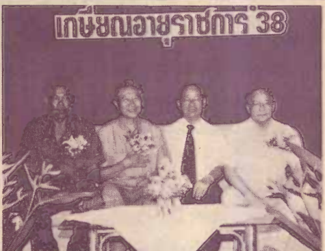
เกษียณอายุราชการ 38