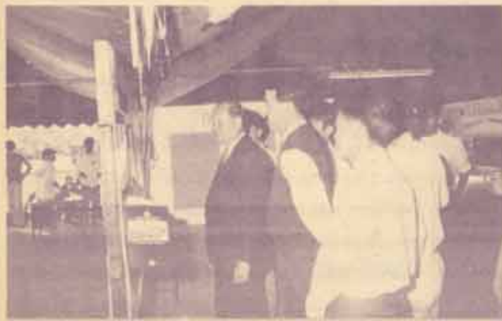
รายนามโรงเรียนที่ร่วม ชม สาขาศาสนาธรรม ศร.วิจิตร ศรีสถิติน ปติศตวรรษมหาวิทยาลัย เป็นประธานเปิดงานนิทรรศการ "รวม คำแห่งอักษร ๗๗" เมื่อวันที่ 3 ธันวาคม 2533 ณ บริเวณสนามฟุตบอล งานนี้จัดโดยองค์การนักศึกษา มหาวิทยาลัยรามคำแหง ร่วมกับ 24 ชมรมวิชาการ จนถึงวันที่ 9 ธันวาคม 2533 โดยมีกิจกรรมต่าง ๆ อาทิ งานเวที อภิปราย เสวนา แสงวาที และปาฐกถา