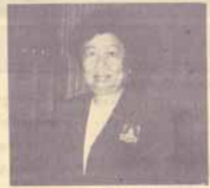
ดารา รังสาธต์