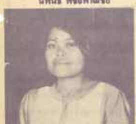
นภาพ นินละนาช