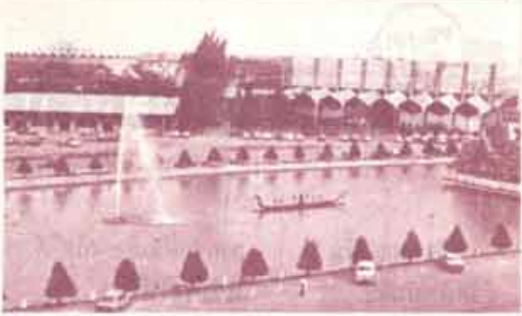
2. หมดอายุแล้ว ต้องสมัครใหม่