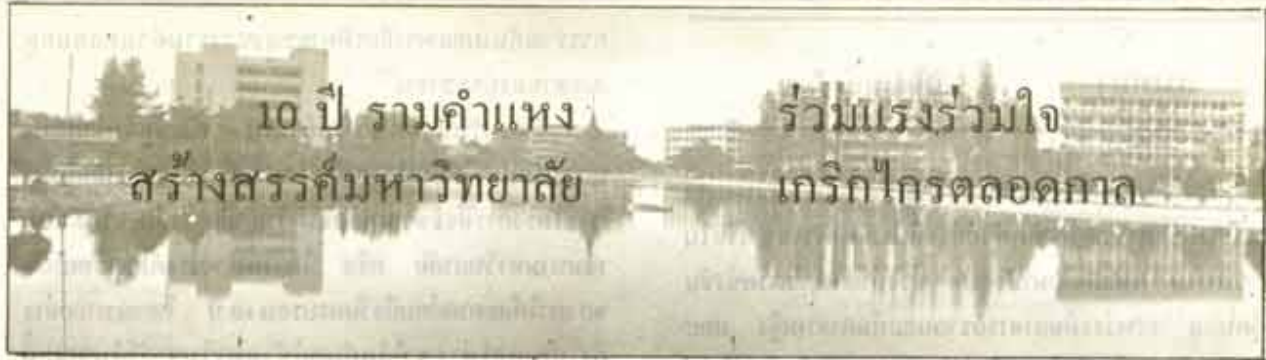
10 ปี รามคำแหง สร้างสรรค์มหาวิทยาลัย