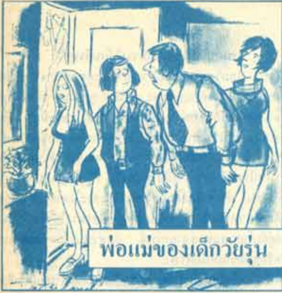
พ่อแม่ของเด็กวัยรุ่น