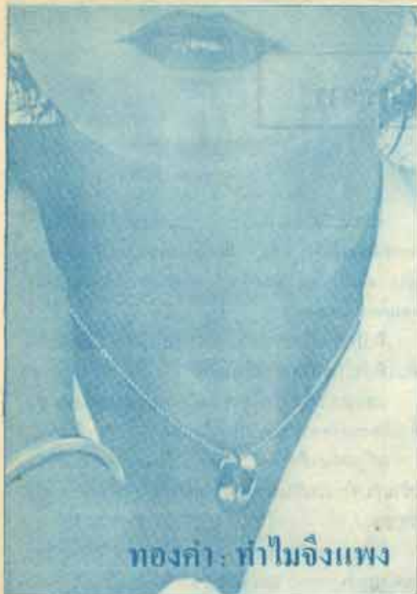
ทองคำ: ทำไม่จึงแพง