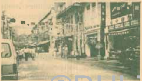
ถนนสายหนึ่งในย่านการค้าแห่งหนึ่งในสิงคโปร์

ศูนย์การค้าในกรุงกัวลาลัมเปอร์ในย่านถนนสายสำคัญ เช่น ถนนอัมปัง (Jalan Ampang) [ถนนสายนี้มีสถานทูตของประเทศต่างๆ ตั้งอยู่คล้ายถนนวิฑูญและถนนสาทรของเรา สถานเอกอัครราชทูตไทย ก็ตั้งอยู่ที่ 206 Jln, Ampang เช่นเดียวกัน] มีการแต่งร้านประดับไฟบ้าง ตามศูนย์การค้าจะนำอาหารและขนมที่นิยมรับประทานกันในเทศกาลนี้มาจัดไว้เป็นมุมเฉพาะให้เลือกซื้ออาหารและขนมประจำเทศกาล เช่น กุนเชียง หมูแผ่น หมูหยอง เป็ดเค็ม ไช้เยี่ยวม้า วิกส์ ลูกกวาด ลูกอม ซ็อกโกแลตชนิดต่างๆ ถั่วลิสงอบทั้งเปลือก เมล็ดแตงโม ขนมรูปตัวสัตว์ต่างๆ ขนาดพอดีคำ (เช่นขนมกล้วยขนมทองเอก แต่มีสรเหมือนขนมสัง-ผสมขนมไม้ก่) ทองพับ (ทองม้วนแผ่นกลมแต่พับ 2 ทบ) ฯลฯ อาหารเหล่านี้จะวางขายล่วงหน้าราว 2-3 สัปดาห์ และเมื่อใกล้วัน