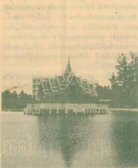
ที่ใหม่จึงสร้างศาลากลางน้ำรามคำแหง และจะ สร้างเรือหงส์อีกหรือไม

จ่ายของมหาวิทยาลัยได้จากค่าหน่วยกิตจำนวน 2 ใน 3 ในขณะที่รัฐบาลช่วยงบประมาณเพียง 1 ใน 3 ซึ่งเทียบ กับมหาวิทยาลัยอื่น ๆ ยกเว้นสุโขทัย นักศึกษาของเรา ต้องจ่ายช่วยตัวเองมากกว่านักศึกษาของมหาวิทยาลัยอื่น จึงไม่ยุติธรรมที่จะขึ้นค่าหน่วยกิต ปัจจุบันมหาวิทยาลัย ก็ไม่ได้มีปัญหาเรื่องเงิน จนกระทั่งต้องตัดค้างเงินเดือน ไม่ทราบว่าจะไปเอาเข้ามาจากไหน ทุกวันนี้มหาวิทยาลัย ก็สามารถใช้จ่ายเงินงบประมาณจากรัฐบาลและจากรายได้ ค่าหน่วยกิตเพียงพอ การที่มีคนพูดเช่นนั้นอาจจะ เพราะในระยะหลังมหาวิทยาลัยใช้นโยบายประหยัด เช่น ตัดการทำงานล่วงเวลาที่ไม่จำเป็น คอบคุมค่าใช้จ่ายเรื่อง การไปราชการทั้งนอกและในประเทศ และตัดค่าตอบแทน บางประเภทที่ไม่สมควรจ่าย เป็นต้น ขอเรียนว่านโยบาย ประหยัดเกิดขึ้นไม่ใช่เพราะไม่มีเงิน แต่เป็นเรื่องของ เหตุผลและความถูกต้อง ถึงจะมีเงินก็ควรประหยัดตัด รายจ่ายที่ไม่จำเป็น ตลอดระยะเวลาที่เป็นอธิการบดีมา 4 ปี ไม่เคยไปถอนเงินฝากสะสมของมหาวิทยาลัยที่มี เก็บไว้ในรูปของเงินฝากประจำและพันธบัตรรัฐบาลมาใช้ เลย แต่ละปีก็ใช้เฉพาะงบประมาณแผ่นดินที่ได้รับและ รายได้จากค่าหน่วยกิตเท่านั้น และทุกปีก็พอมิเหลือเก็บ สะสมอีกปีละ 2 - 3 ล้าน เพราะฉะนั้นขอยืนยันว่า สถานะการเงินของมหาวิทยาลัยไม่ได้มีปัญหาอะไรเลย