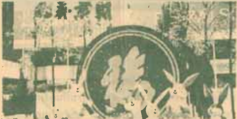
หน้าศูนย์การค้าแห่งหนึ่งในสิงคโปร์

ก็จะถูกให้ออก (ระบบ repeated และ retired) ในภาค 2 นี้ นักศึกษาส่วนมากจึง เตรียมสอบกันหามรุ่งหามค่ำ นอนกันเพียงคืนละ 3-4 ชั่วโมง