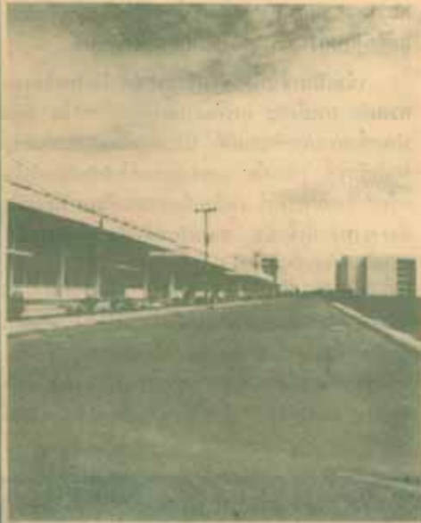
ตึก เอ็น.บี. ที่รวมฯ 2 ว่าจะจะเปิดใช้สักกี่ปีหรือ ว่าจะเปิดไปตลอดกาล ซึ่งแฉงรยละเอียดให้ ทราบด้วย

ตึก เอ็น.บี. ที่รวมฯ 2 ทั้ง 11 หลัง ขณะนี้เป็นคดีฟ้องร้อง อยู่ในศาลเกี่ยวกับทรุดของพื้น มหาวิทยาลัยโดย อดีตอธิการบดีได้ฟ้องร้องให้ผู้ที่เกี่ยวข้องกับการก่อสร้าง รับผิดชอบ คดีอยู่ในระหว่างการสืบพยาน เพราะฉะนั้น จึงต้องเก็บตึกดังกล่าวเป็นหลักฐานเพื่อมิให้เสียรูปคดี การยอมคดีหรือซ่อมแซมไปก่อนโดยที่ศาลยังไม่สรุปคดี อาจถูกมองว่า เป็นการทำลายหลักฐานและทำให้มหา วิทยาลัยเสียหายในทางคดี จึงต้องเก็บสภาพเช่นนั้นไว้ แม้จะเป็นภาพที่ไม่น่าดูนักก็ตาม