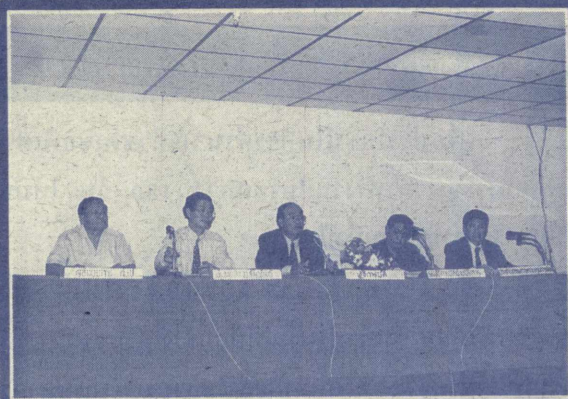
ประชุมสอบไล่ ศาสตราจารย์รังสรรค์ แสงสุข อธิการบดีมหาวิทยาลัยรามคำแหง เป็นประธานการประชุมชี้แจงรายละเอียดระเบียบปฏิบัติในการสอบไล่ภาค 1 ปีการศึกษา 2540 เมื่อวันที่ 9 ตุลาคม 2540 ณ สำนักงานสภาอาจารย์

“บัณฑิตที่จะเข้ารับพระราชทานปริญญาบัตรทุกท่านต้องมาฝึกซ้อมตามวันเวลาที่มหาวิทยาลัยกำหนด เพื่อประโยชน์ของตัวบัณฑิตเอง หากไม่ได้เข้ารับการฝึกซ้อมมหาวิทยาลัยจะตัดสิทธิ์ในการเข้ารับพระราชทานปริญญาบัตร”