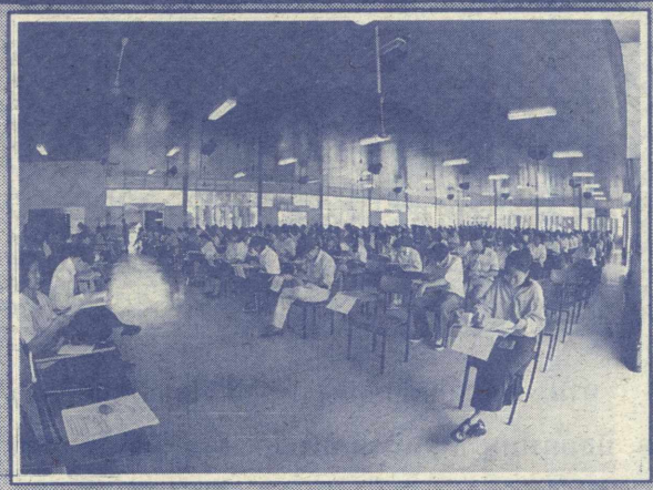
สอบไล่ มหาวิทยาลัยรามคำแหง ดำเนินการ- สอบไล่ภาค 1 ปีการศึกษา 2540 ระหว่างวันที่ 13 ตุลาคม- 7 พฤศจิกายน 2540 โดยเว้นวันที่ 23 ตุลาคม และวันที่ 2 พฤศจิกายน 2540

ส่วนกรณีที่นักศึกษามีความประสงค์จะขอ เปลี่ยนวิชาเอกในสาขาเดียวกัน (คณะรัฐศาสตร์ เศรษฐศาสตร์) นักศึกษาไม่ต้องชำระค่าธรรมเนียมและ ดำเนินการใด ๆ ที่ สวป. ทั้งสิ้น