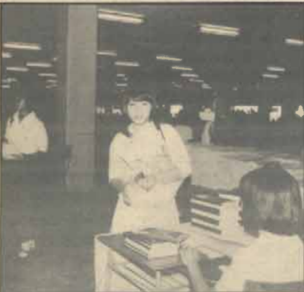
หนังสือปฐมนิเทศ มหาวิทยาลัยจัดพิมพ์หนังสือปฐม นิเทศ ปี 2528 แจกแก่นักศึกษาใหม่ทุกคนในวันสมัคร โดย เจ้าหน้าที่งานประชาสัมพันธ์ น.ร. ได้แจกหนังสือปฐมนิเทศ แก่นักศึกษาใหม่ทุกคน ณ ชั้น 5 ของอาคารรับสมัครทั้ง 2 แห่ง ทั้งนี้เพื่อประโยชน์แก่นักศึกษาใหม่ที่จะได้รู้จักมหาวิทยาลัย รามคำแหงดียิ่งขึ้น