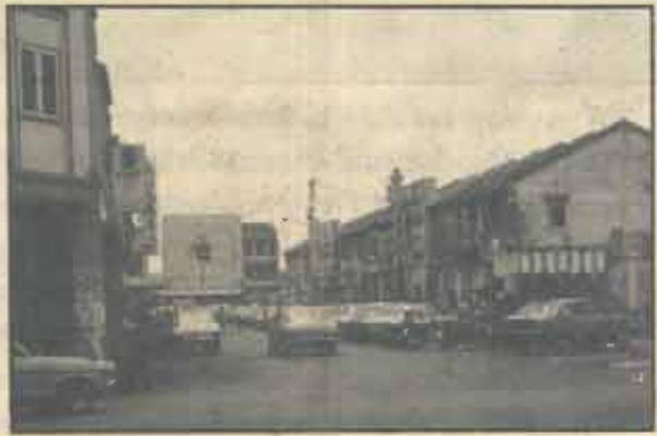
ร้านค้าในสิงคโปร์

THIS PASS IS VALID ONLY FOR THE DATE SHOWN HEREIN