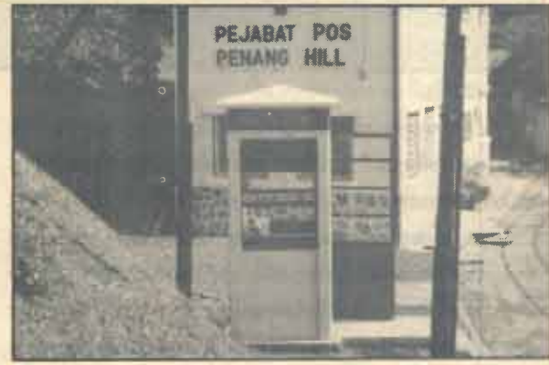
ที่ทำการไปรษณีย์และตู้โทร ศัพท์บนยอดเขาป็นังฮิลล์

ในกำหนดการเดินทางมีว่า ขาดของเราจะเดินทางออกจากเมืองไทยทางด้านสะเดา และเข้ามาเลเซียที่ด่านจิงโหลน ไปค้างที่ป็นักก่อนแล้วเดินทางไปทางฟากตะวันตกของมาเลเซียที่เป็นด้านทะเลอันดามัน เข้าสู่สิงคโปร์ เมื่อกลับจากสิงคโปร์จะเดินทางขึ้นมาทางฟากตะวันออกของมาเลเซีย ที่เป็นด้านมหาสมุทรแปซิฟิก ออกจากมาเลเซียที่ด่านรันตูปมวง และเข้าเมืองไทยที่ด่านสุโขทัย-ถก ทั้งนี้เพื่อมิให้ข้าทางเดิมออกจากที่จำเป็นจริง ๆ