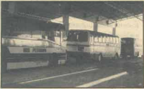
รถที่นำคนจากมาเลเซียหรือตรวจเข้าเมืองที่ด่านสะเดา คำว่า Bas Pesiaran ที่ข้างรถแปลว่า "รถที่นำคน"

รศ.ทองสุข เกตุโรจน์ คณะมนุษยศาสตร์ มหาวิทยาลัยรามคำแหง