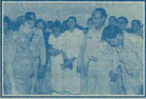
ต้อนรับนายกรัฐมนตรี