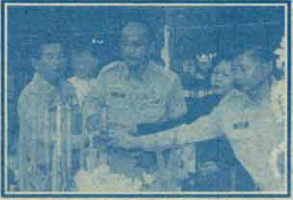
อธิการบดีเป็นประธานในพิธีวงสรวง