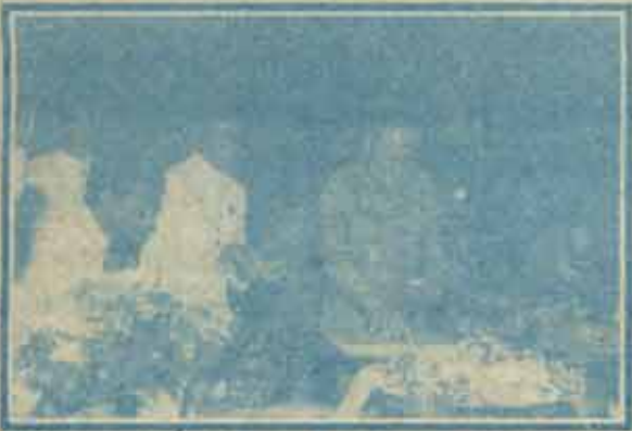
นายกรัฐมนตรีวางศิลาฤกษ์