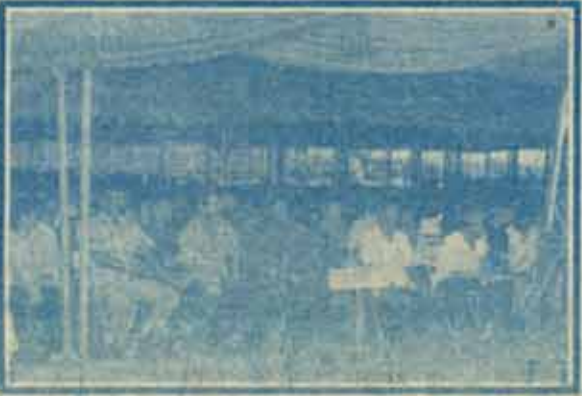
ชาวอุทัยธานีกำลังใจนายกรัฐมนตรี