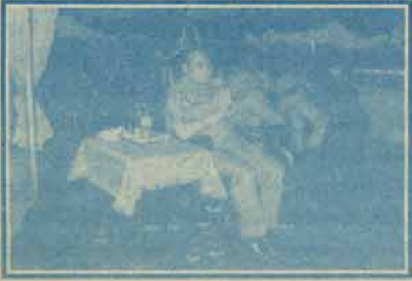
นายกรัฐมนตรีเป็นประธานในพิธีวางศิลาฤกษ์