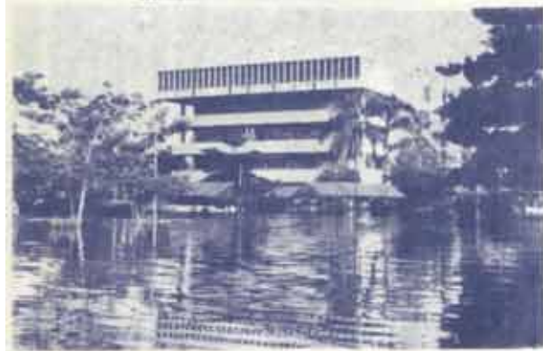
สภาพน้ำท่วมบริเวณหน้าคณะมนุษยศาสตร์