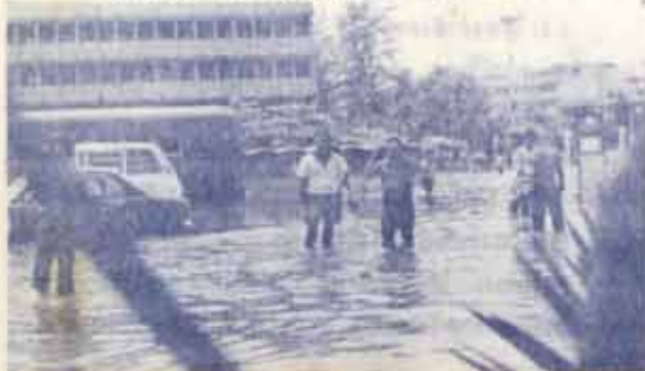
กรรมการเฉพาะกิจกำลังอำนวยความสะดวกแกไขปัญหาน้ำท่วม