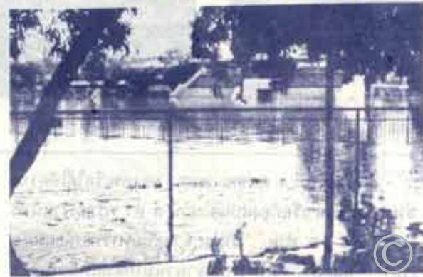
สภาพน้ำท่วมบริเวณสนามกีฬา น.ร.