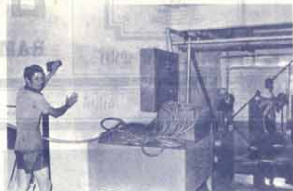
เจ้าหน้าที่จากหน่วยบรรเทาสาธารณภัย กำลังช่วย น.ร.