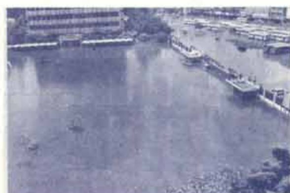
สภาพน้ำท่วมบริเวณประตูเข้ามหาวิทยาลัย