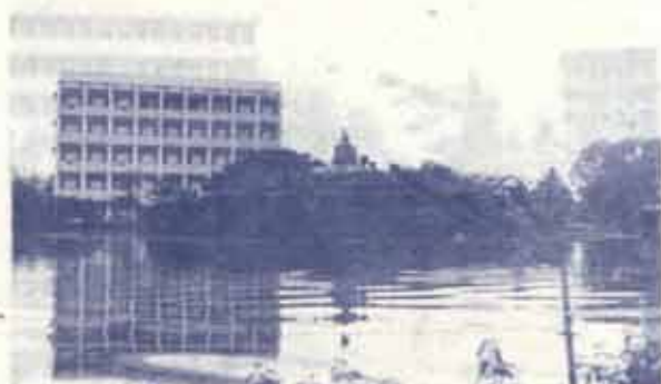
สภาพน้ำท่วมบริเวณลานพ่อบุญ