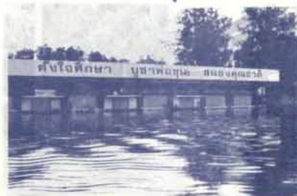
สภาพน้ำท่วมบริเวณลาน สวป.