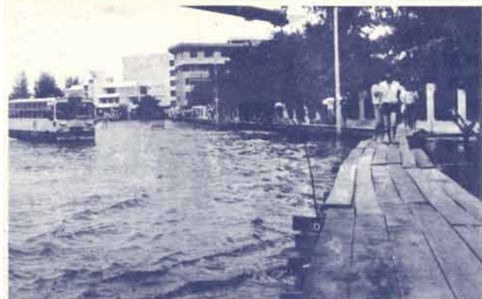
ทางเดินชั่วคราวบริเวณด้านหน้ามหาวิทยาลัย