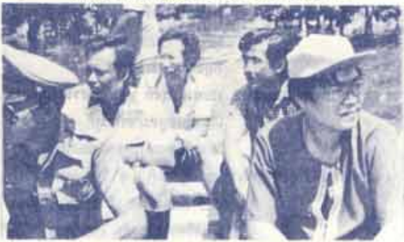
กรรมการเฉพาะกิจออกตรวจงาน