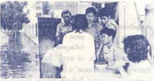
เจ้าหน้าที่มหาวิทยาลัยร่วมกับเจ้าหน้าที่ตำรวจ กำลังตรวจตราบุคคลเข้าออกใน น.ร.