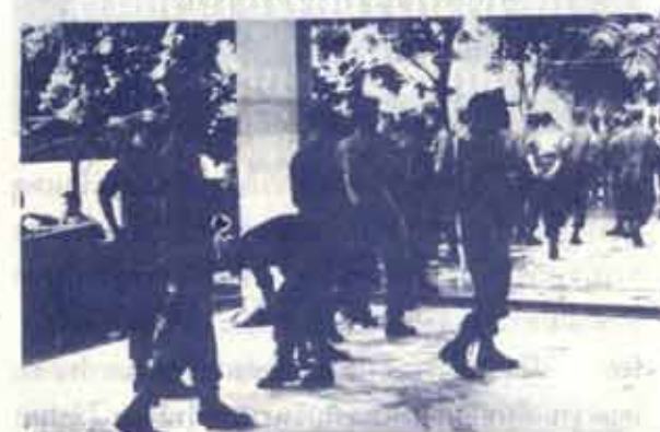
ทหารบกที่เข้ามาช่วยมหาวิทยาลัย