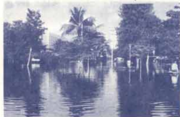
สภาพน้ำท่วมบริเวณด้านหน้า AD.1