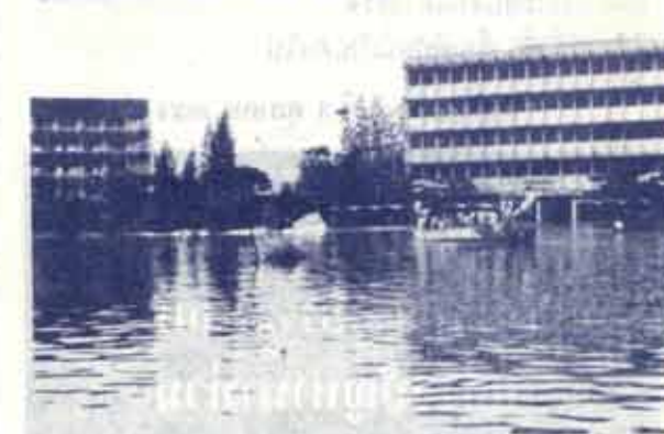
กองทัพอากาศได้ส่งทหารและเรือมาช่วย น.ร.