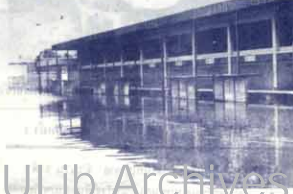
สภาพน้ำท่วมที่บริเวณคลังรถจักรยานยนต์ น.ร. 14