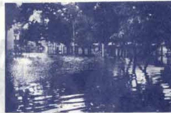
สภาพน้ำท่วมบริเวณด้านหน้าคณะรัฐศาสตร์