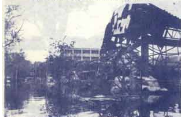
ไฟไหม้ยังไม่ทันหมดกลิ่น น้ำก็ปริ่มท่วมทับ