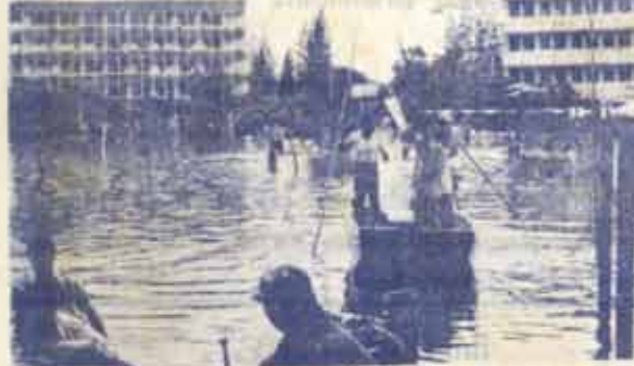
เจ้าหน้าที่ของมหาวิทยาลัยกำลังอำนวยความสะดวกทำงาน