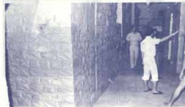
กรรมการเฉพาะกิจร่วมกับเจ้าหน้าที่ฝ่ายค้ำรา กำลังเตรียมงานเพื่อขนย้ายค้ำรา