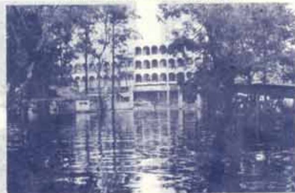
สภาพน้ำท่วมบริเวณทางเข้าด้าน NB.1