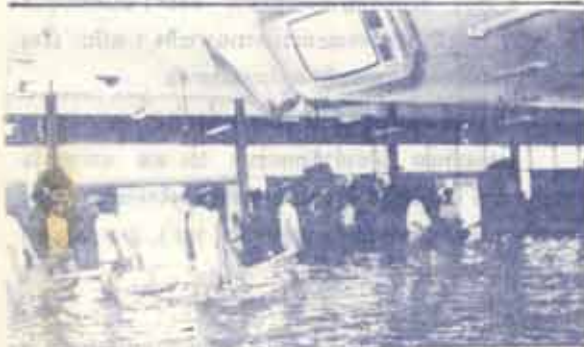
ทหารเรือกำลังช่วยขนเก้าอี้ตามห้องบรรยาย