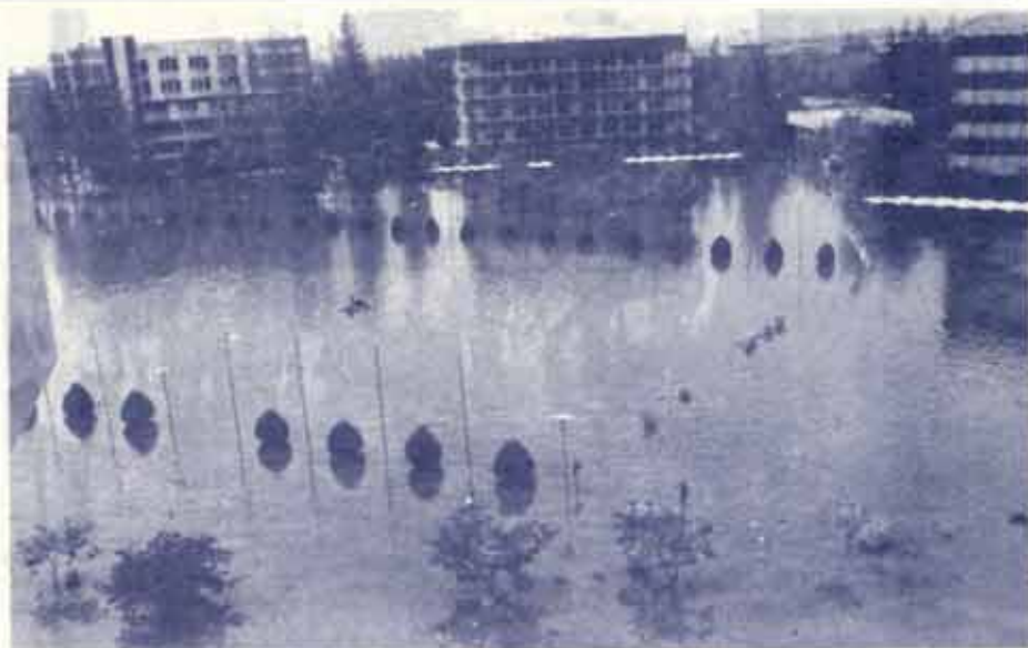
สภาพน้ำท่วมบริเวณสระน้ำหน้าตึกอภิการบดี