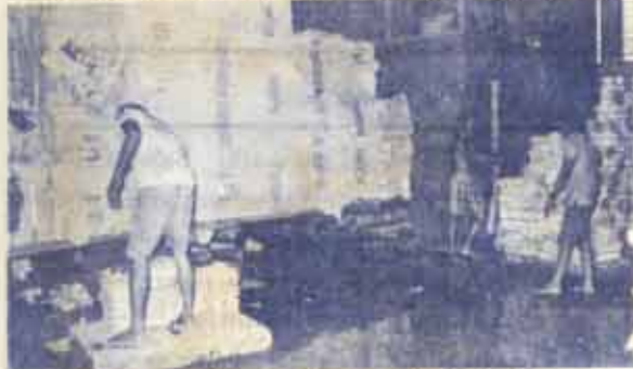
เจ้าหน้าที่โรงพิมพ์กำลังขนย้ายสิ่งพิมพ์