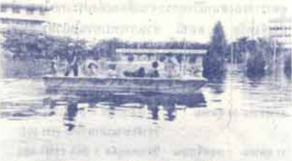
เรือรับส่งอาจารย์และข้าราชการไปทำงาน