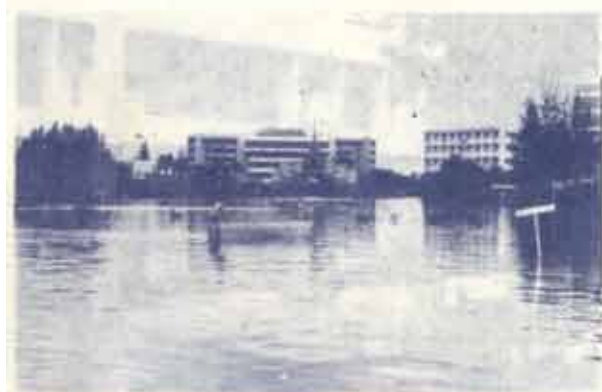
สภาพน้ำท่วมบริเวณศาลากลางน้ำ