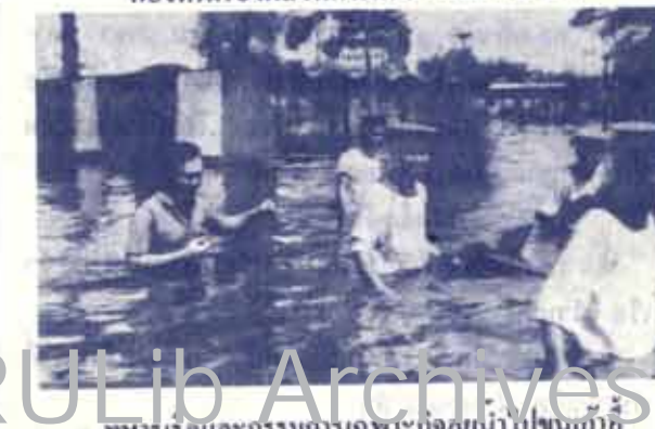
ทหารเรือและกรรมการเฉพาะกิจลุยน้ำไปขนเก้าอี้