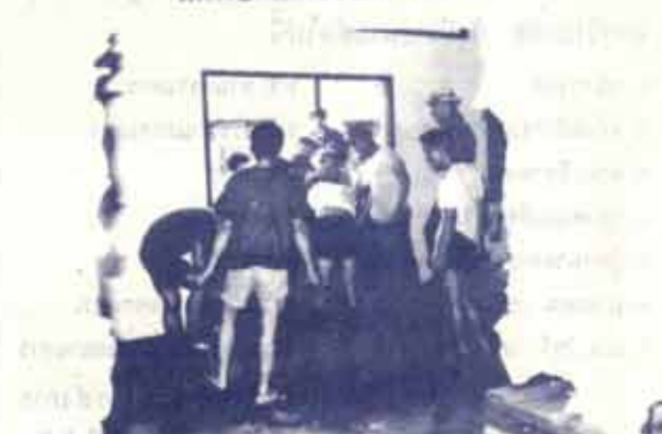
ทหารบกพร้อมกับเจ้าหน้าที่ น.ร. กำลังขนกระสอบทรายกั้นน้ำ