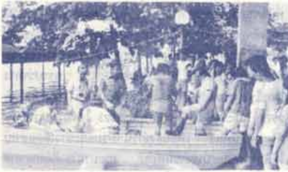
อธิการบดีออกตรวจงานรอบมหาวิทยาลัย