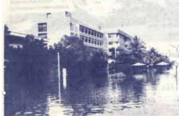
สภาพน้ำท่วมด้านหน้าตึกคณะเศรษฐศาสตร์