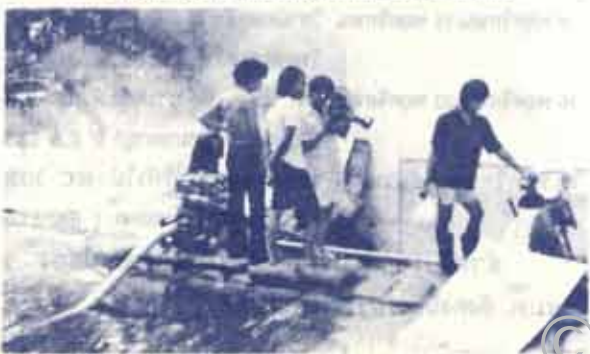
ช่างภาพ น.ร. กำลังบันทึกภาพสถานการณ์น้ำท่วมหลังหอสุมุด