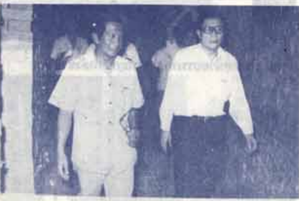
นายกสภามหาวิทยาลัยเกษม น.ร. ที่ประสพปัญหาน้ำท่วม

ปีที่ 10 ฉบับที่ 24 ปีการศึกษา 2523 11 ตุลาคม 2523 ราคา 75 สตางค์