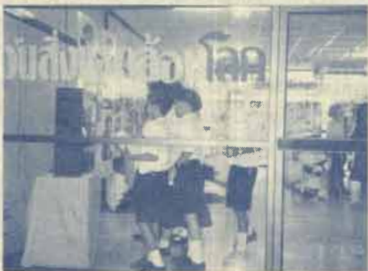
นักเรียนจากโรงเรียนต่าง ๆ ให้ความสนใจงาน

และบริษัท กรีนสปอต (ประเทศไทย) จำกัด ในการจัดงานครั้งนี้มีผู้สนใจเข้าร่วมชมนิทรรศการ จำนวนโดยประมาณ 2,500 คน