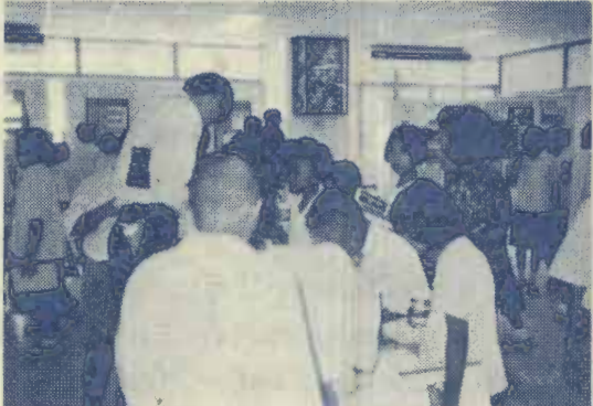
อาจารย์และนักเรียนระดับประถมศึกษาสนใจการรักษาคุณภาพสิ่งแวดล้อม