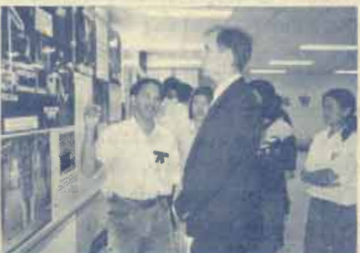
นักวิชาการวิทยาศาสตร์สิ่งแวดล้อม ชาวต่างประเทศให้ความสนใจ