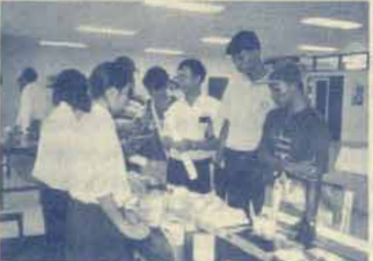
อธิบายการใช้อุปกรณ์ป้องกันมลพิษทางอากาศ