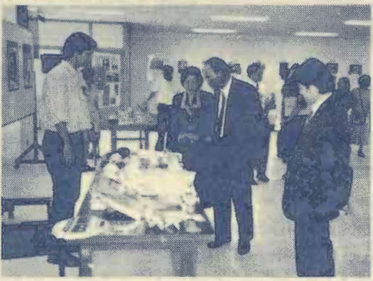
อธิการบดีและคณบดีชมนิทรรศการ