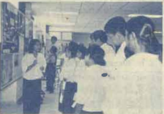
นักศึกษาสาขาวิชาวิทยาศาสตร์สิ่งแวดล้อม อธิบายการจัดการขยะติดเชื้อ