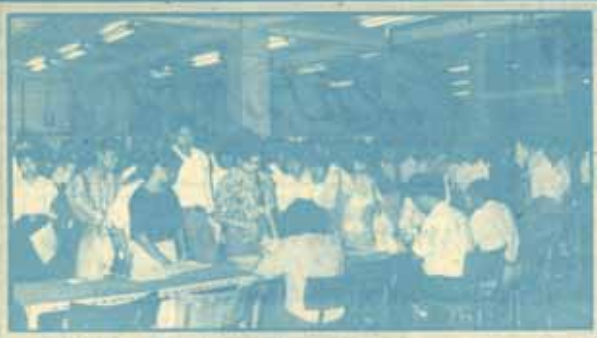
นักศึกษาใหม่ภาค 2 มหาวิทยาลัยรามคำแหง รับสมัครนักศึกษาใหม่ ในภาค 2 ปีการศึกษา 2534 ที่ม.ร. (อาคาร K.L.B) เมื่อวันที่ 9-10 พฤศจิกายน 2534 มีผู้สนใจสมัครเป็นนักศึกษา จำนวน 12,044 คน