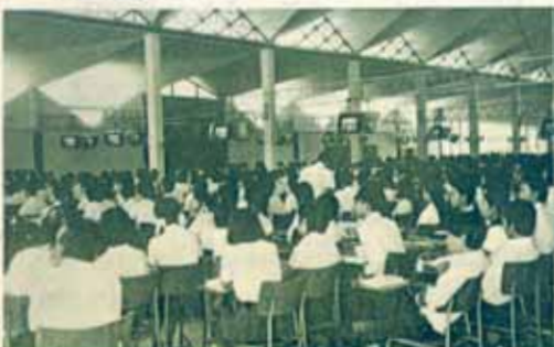
นักศึกษาที่กินใจฟัด จงจำ และศึกษาน