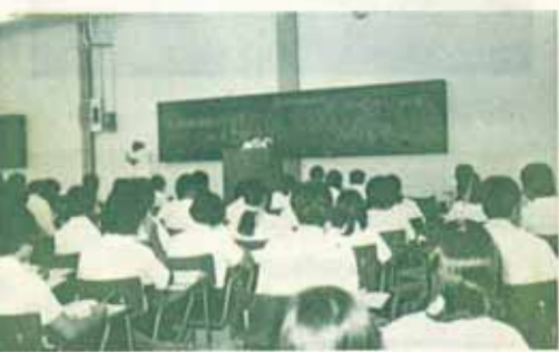
ขณะเข้าเรียนวิชาเศรษฐศาสตร์