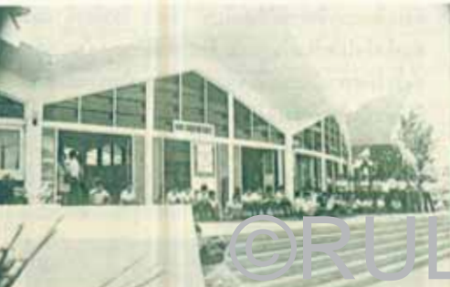
ภายในที่ทำการของอาจารย์