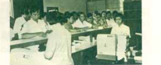
เจ้าใช้เรียนภาษาฝรั่งเศส ชั้นเรียนภาษาฝรั่งเศส