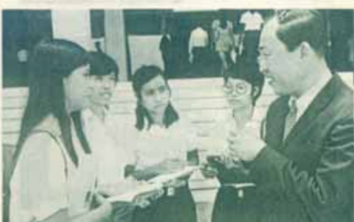
นิสิตศึกษา เพื่อปรึกษาคำถามด้านนิเวศวิทยาของ ม.ร. กำลังเรียนชั้นภาคเรียนการศึกษา

มหาวิทยาลัยของเราเปิดกว้างเพื่อการศึกษาแก่ประชาชน