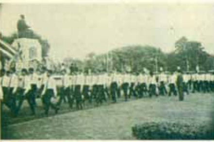
คณะนิติศาสตร์วงพวงมาลา และบันเพ็ญกุศลวันระพี