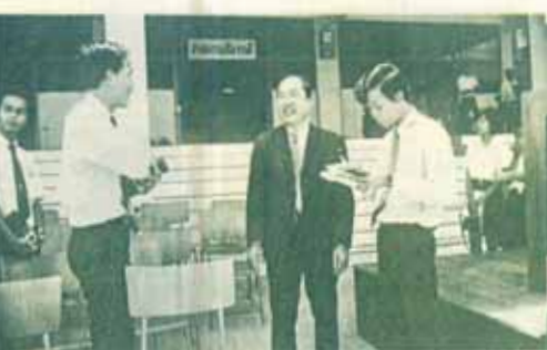
สิ้นวอชอน มินนิชิตภาพและข่าว