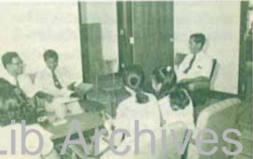
นิสิตศึกษา เพื่อปรึกษาคำถามด้านนิเวศวิทยาของ ม.ร. กำลังเรียนชั้นภาคเรียนการศึกษา