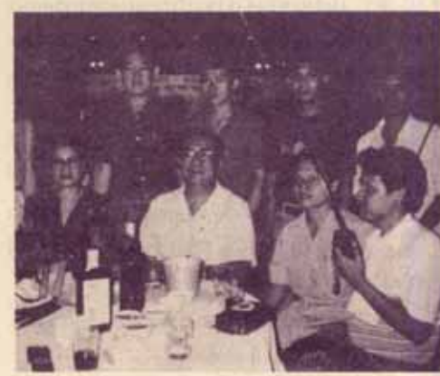
ส่วนหนึ่งของสมาชิกชมรมนักวิทยุสมัครเล่นข้าราชการและเจ้าหน้าที่มหาวิทยาลัยรามคำแหง ร่วมงาน "วิทยุสมัครเล่น สดุดีมหาราชา" เมื่อวันที่ 5 ธันวาคม 2534 ณ กรมไปรษณีย์โทรเลข