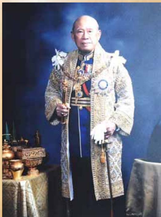
จอมพลถนอม กิตติขจร พ.ศ. ๒๕๑๔ – ๒๕๑๕