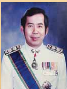
ศาสตราจารย์ ดร.ธรรมบุญ โสภารัตน์ ๑๓ พ.ค. ๒๕๓๐ – ๑๒ พ.ค. ๒๕๓๒