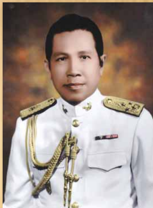
พลเอกแสวง เสนาณรงค์ พ.ศ. ๒๕๑๕ – ๒๕๑๗