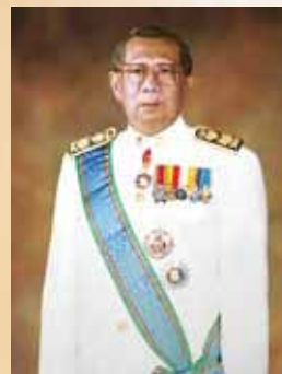
รองศาสตราจารย์ ดร.อภิรhyth ฦ นคร ๓ ต.ค. ๒๕๒๓ – ๒ ต.ค. ๒๕๒๕