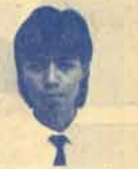
นายเทพฯ กุสัทธ์ 30101578 รองนายกฯ คนที่ 3