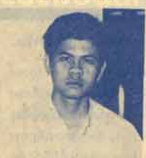
นายกมลคุณธ์ สร้อยสิงห์ พรรคพัฒนาปัญญาชน