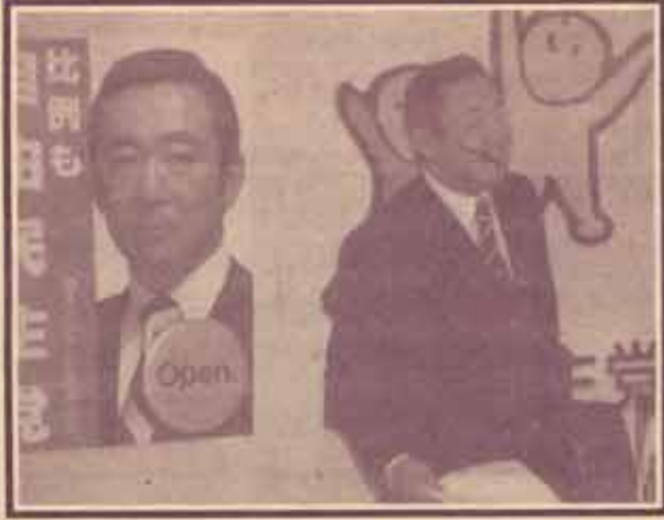
'เลือกตั้งในประเทศไทย'

ปฏิรูปการเมืองขึ้นโดยเฉพาะระบบเลือกตั้ง ระบบเลือกตั้งที่ปฏิรูปใหม่ของญี่ปุ่น กำหนดเป็นแบบ-ผสม คือประกอบด้วย 1. รูปแบบแรก ใช้ระบบแบ่งเขตเขตละหนึ่งคน 2. รูปแบบที่สอง ใช้ระบบสัดส่วนคะแนนเสียง เป็นระบบที่ให้ประชาชนเลือกพรรคการเมือง และผู้ที่จะได้เป็นผู้แทนราษฎรก็ขึ้นอยู่กับบัญชีรายชื่อที่พรรคการเมืองเสนอให้ประชาชนได้รับทราบก่อนการเลือกตั้งเรียงตามลำดับ โดยรูปแบบแรกมี ส.ส. 300 คน รูปแบบที่สองมี ส.ส. 200 คน รวมทั้งสองรูปแบบก็จะมี ส.ส. ในสภาผู้แทนราษฎรจำนวน 500 คน ซึ่งระบบเลือกตั้งใหม่นี้ได้ใช้เป็นที่แรกในการเลือกตั้งวันที่ 20 ตุลาคม 2539 นี้