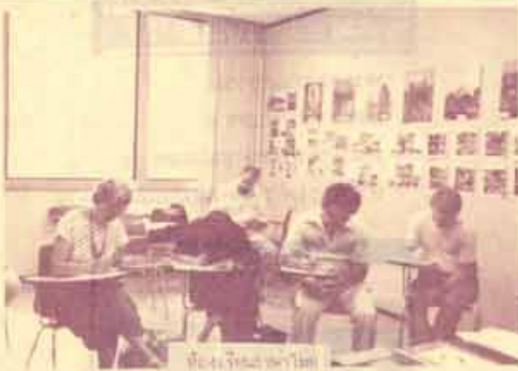
ปีนี้ได้จัดให้มีขึ้นในระหว่างวันที่ 1 ถึง 3 กรกฎาคม ดังกล่าวแล้ว

Southeast Asian Studies Summer Institute คือ โครงการศึกษาสำหรับนักศึกษาทั่วสหรัฐอเมริกาที่สนใจจะเรียนภาษาภาคพื้นเอเชียตะวันออกเฉียงใต้ เป็นโครงการที่จัดร่วมกับระหว่างมหาวิทยาลัย 11 แห่งในสหรัฐอเมริกา คือ มหาวิทยาลัยฮอโนโลลู สเตต มหาวิทยาลัยแคลิฟอร์เนีย-เบิร์กลีย์ มหาวิทยาลัยคอร์เนลล์ มหาวิทยาลัยฮาวาย มหาวิทยาลัยอิลลินอยส์-แชมเปญ มหาวิทยาลัยเคนตักกี มหาวิทยาลัยมิชิแกน มหาวิทยาลัยนอร์เทิร์น อิลลินอยส์ มหาวิทยาลัยโอไฮโอ มหาวิทยาลัยวิสคอนซิน-เมดิสัน และมหาวิทยาลัยเยล