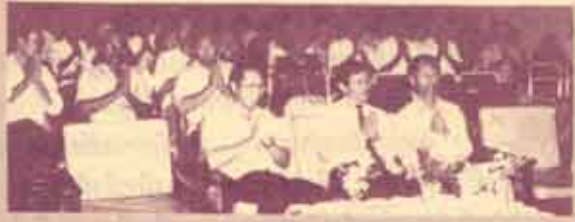
กองกิจการนักศึกษาทำบุญ กองกิจการศึกษาม.ร. ทำบุญ-เลี้ยงพระในโอกาสปีใหม่ เมื่อวันที่ 6 มกราคม 2532 ณ ที่ทำการกองกิจการนักศึกษา ตึกกิจกรรมฯ ชั้น 2