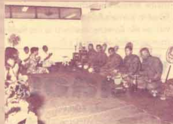
กองอาคารฯ ทำบุญ กองอาคารสถานที่ ทำบุญ-เลี้ยงพระ ในโอกาสปีใหม่ เมื่อวันที่ 6 มกราคม 2532 ณ ที่ทำการกองอาคารสถานที่