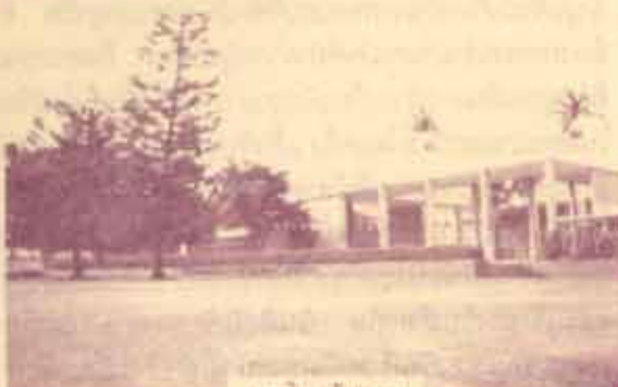
SEASSI เริ่มขึ้นเป็นครั้งแรกในปี 1982 โดยมีมหาวิทยาลัยโอไฮโอเป็นเจ้าภาพ ภาษาแรกที่เปิดสอนก็คือภาษาอินโดเนเซียน จากนั้น จึงมีภาษาอื่น ๆ เพิ่มขึ้นตามความต้องการของผู้เรียนที่ไม่อาจจะหาวิชาอื่น ๆ เรียนที่มหาวิทยาลัยของตนเองได้

ในฤดูใบไม้ร่วงปี 1986 มหาวิทยาลัยฮาวายมีนักศึกษาลงทะเบียน 18,967 คน ในจำนวนนี้เป็นนักศึกษาระดับสูงกว่าปริญญาตรี 4,558 คน นักศึกษามาจากรัฐทั้ง 50 รัฐ และจากต่างประเทศ 71 ประเทศ เป็นนักศึกษาจากแผ่นดินใหญ่สหรัฐฯ ประมาณปีละ 1,730 คน จากต่างประเทศประมาณ 1,000 คน มหาวิทยาลัยเปิดสอนระดับปริญญาตรี 89 สาขา ปริญญาโท 62 สาขา และปริญญาเอก 35 สาขา ปีที่แล้วมีบัณฑิตระดับปริญญาตรี 2,700 คน ปริญญาโท 900 คน ปริญญาเอก 273 คน มหาวิทยาลัยได้งบประมาณปีละ 315,000,000 ดอลลาร์ มีอาจารย์และเจ้าหน้าที่ 6,898 คน ลองเปรียบเทียบสถิติเหล่านี้กับมหาวิทยาลัยรามคำแหงดูว่าอย่างไร