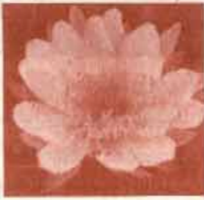
ศาสตราจารย์ ระพี สาคริก

บัว เป็นพันธุ์ไม้ที่พบอยู่ตามธรรมชาติทั่ว ๆ ไปในเขตร้อน และเป็นพันธุ์ไม้ประเภทหนึ่งซึ่งได้รับความสนใจกันอย่างกว้างขวาง ผู้เขียนจะไม่นำเอาเรื่องราวที่เป็นวิชาการยากลำบากและหนักสมองชาวบ้านมากกล่าวในที่นี้ แต่จะขอเขียนในทัศนะที่ชาวบ้านทั่ว ๆ ไปจะเข้าใจได้เพราะสำนึกเสมอว่าชาวบ้านคือคนส่วนใหญ่ของเรา ส่วนใครที่มีพื้นฐานความรู้สูงหน่อย สนใจลึกซึ้งลงไปอีก ก็คงจะไปค้นคว้าหาความรู้เพิ่มเติมเอาได้เองโดยไม่ยากนัก