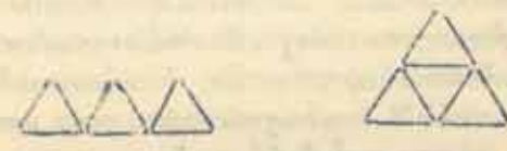
รูปที่ 1 รูปที่ 2

คราวนี้ลองให้ท่านผู้อ่านคิดปัญหาสัก 3 ปัญหา นะครับ ปัญหาแรก มีก้านไม้ขีด 9 ก้าน วางเรียงเป็นรูปสามเหลี่ยมด้านเท่า 3 รูป ดังรูปที่ 1 คำถามก็คือจะย้ายก้านไม้ขีด 3 ก้านอย่างไร จึงจะได้รูปสามเหลี่ยมด้านเท่า 5 รูป คำตอบก็คือ รูปที่ 2 คือเป็นรูปเล็ก 4 รูป และรูปใหญ่ 1 รูป นั่นเอง