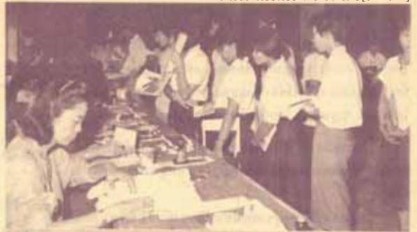
องคมนตรี การลงทะเบียนเรียนที่มหาวิทยาลัย ในภาพ/2529 ซึ่ง...