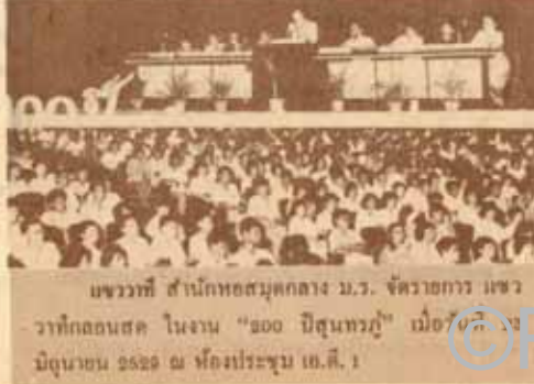
บรรดาที่ สำนักหอสมุดกลาง น.ร. จัดวางแถวบรรดาที่ถนัดสะดวก ในงาน "800 ปีสุนทรภู่" เมื่อวันจันทร์ที่ 1 มิถุนายน 2529 ณ ห้องประชุม เช.ค. 1