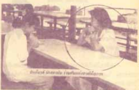
บัณฑิตวิทยาลัย มหาวิทยาลัยรามคำแหง

นักศึกษา ท่านนี้ ขอให้คิดต่อวันของสมนาคุณ ได้ที่ งานประชาสัมพันธ์ ตึก เอ.ดี. ๑ ชั้น ๒ ภายในวันที่ ๒๘ กุมภาพันธ์ ๒๕๓๓ ในรูปและวันมอบของยกย่องแก่คุณ