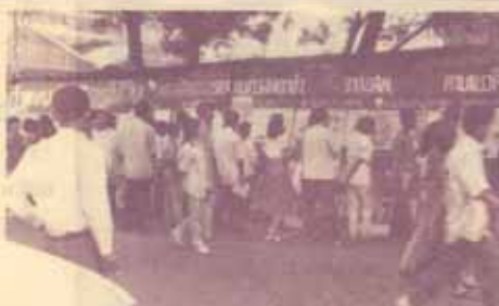
บริการหนังสือพิมพ์รายวันแก่ นส. ณ บริเวณริมรั้วตึกบรรยาย 5 ชั้นที่กำลังก่อสร้าง ซึ่งอยู่ตรงข้ามอาคาร สวป. พรรคสังคมนิยม ได้จัดสร้าง "วันหนังสือ" โดยการนำหนังสือพิมพ์รายวันหลายฉบับ มาติดไว้ให้นักศึกษาและผู้สนใจได้อ่านเป็นประจำทุกวัน