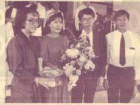
12 ปี "มติชน" ประชาสัมพันธ์ มหาวิทยาลัยรามคำแหง ร่วมแสดงความยินดีในโอกาสครบรอบ 12 ปีหนังสือพิมพ์ "มติชน" เมื่อวันที่ 9 มกราคม 2533