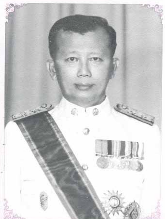
หึ่งตั้งจิตไว้ในกสตรธรรม และตั้งตนไว้ในทางที่ชอบ

(ศาสตราจารย์สง่า ถิ่นสมบัติ) รองอธิการบดีฝ่ายธุรการ