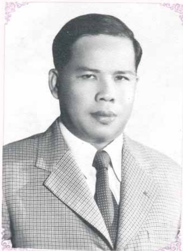
บัณฑิตย้อมมีจิตใจบริสุทธิ์ต่อหน้าที่การงานและ ภาระที่ตนรับผิดชอบ มีความเข้มแข็ง มุมานะและซื่อสัตย์ สุจริต

ขอให้บัณฑิตรุ่นที่สามของมหาวิทยาลัยรามคำแหง มีความสุขและความสำเร็จในชีวิตจงเจริญทุกคน