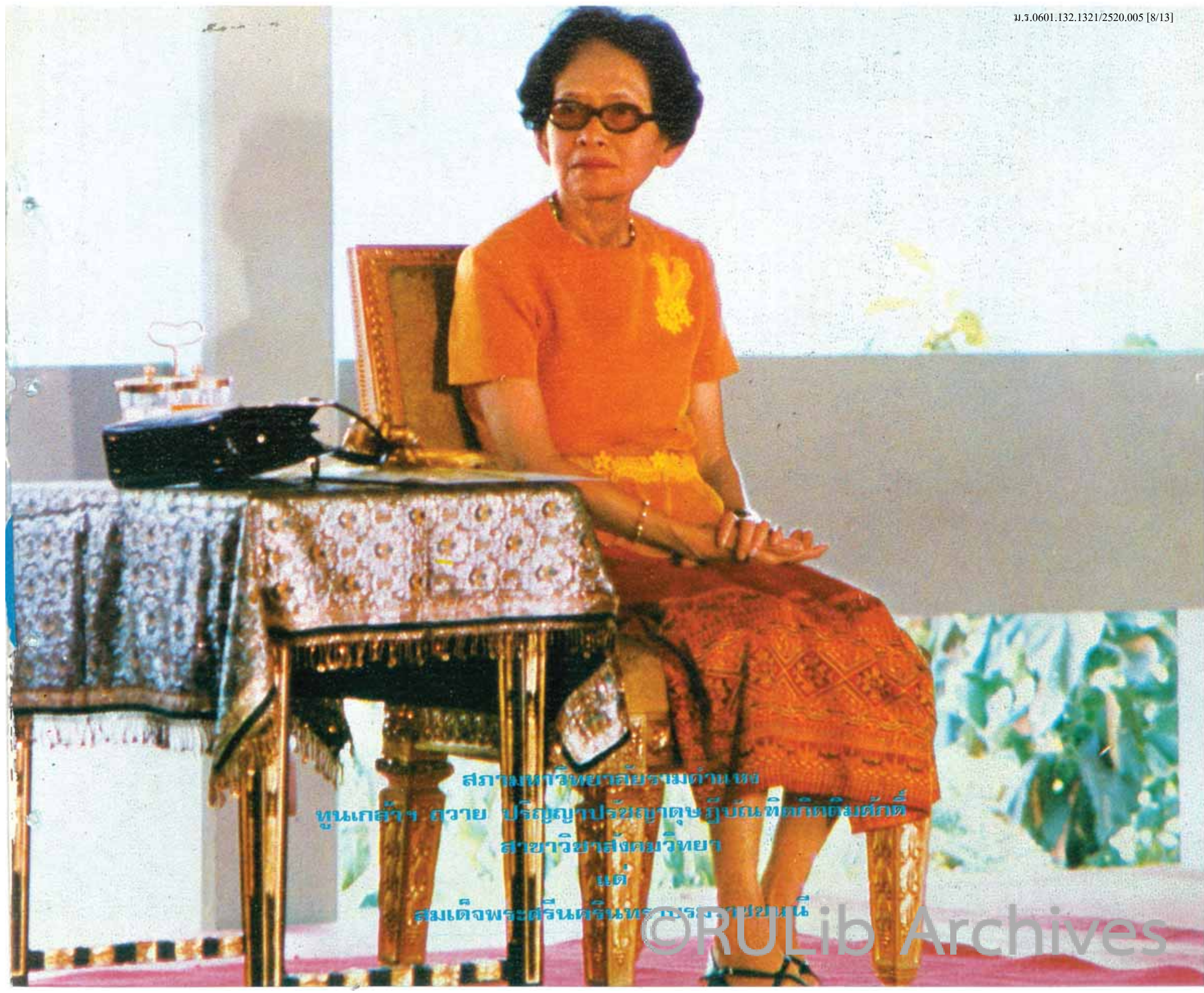
สภามหาวิทยาลัยรามคำแหง คุณเกล้าฯ ถวาย ปริญญาปรัชญาดุษฎีบัณฑิตกิตติมศักดิ์ สาขาวิชาสังคมวิทยา