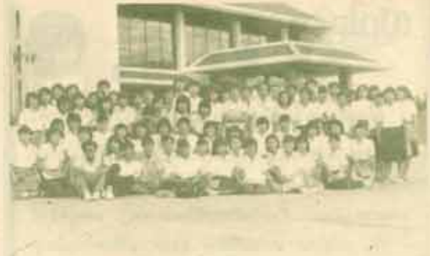
ทัศนศึกษา ชมรมไอซ์เทรียมสามกึ่งหน้า นำสมาชิกไปทัศนศึกษาและดูงาน ณ บริษัท ชะอำ โพลี แอปเปิล เมกานเทรี จำกัด และโรงแรมวีเจนท์ ชะอำ จังหวัดเพชรบุรี เมื่อวันที่ ๒ กันยายน ๒๕๒๖