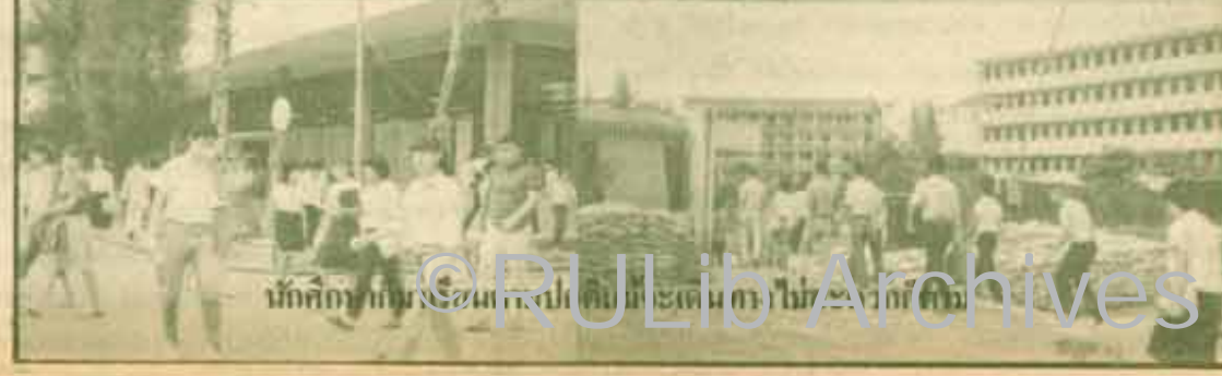
สภาพน้ำท่วม ม.ร. ซึ่งฝั่งตรงข้ามยังมีน้ำขังอยู่