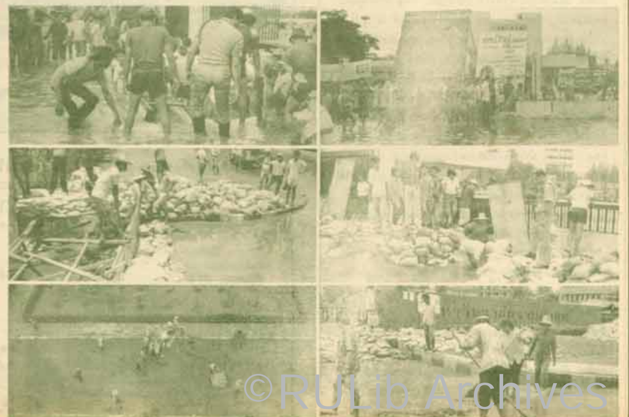
ผู้อยู่เบื้องหลังความสำเร็จในการป้องกันน้ำท่วม คือ เขาเหล่านี้

ข. : แนวป้องกันภายในอาคารสถานที่ป้องกันน้ำท่วม สมศักดิ์ : เป็นเรื่องยากที่ต้องหนักใจนะ ๆ ผมเองเป็นโรค กลัวน้ำ คือกลัวน้ำจะทะลักเข้า แต่ในขณะที่เขื่อนก็มีสิ่งกีด ั้นแล้วด้วยใจคือ เมื่อเกิดเหตุฉุกเฉิน ทั้งผู้บริหาร และเจ้าหน้าที่ของมหาวิทยาลัย ได้ร่วมกันทำงานอย่างไม่รู้จักเหน็ดเหนื่อย ทำให้พวกเราซึ่งมีหน้าที่รับผิดชอบอยู่ รู้สึกอบอุ่นใจมากทีเดียว