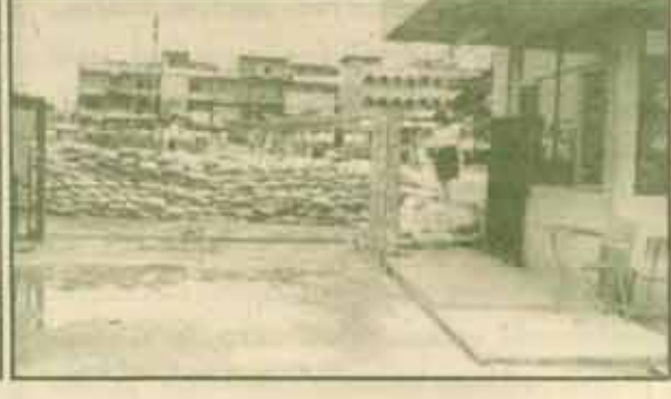
ประมวลาภาพ น้ำท่วมบริเวณหน้า ม.ร. ระหว่าง ๘-๑๔ ก.ย. ๒๖