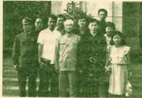
ตารางการรับนักศึกษา**

ในฤดูใบไม้ผลิของปี 1978 สภาแห่งรัฐ (State Council) * จึงได้อนุมัติแผนงานการก่อตั้ง มหาวิทยาลัยวิทยุและโทรทัศน์แห่งชาติขึ้น, มหาวิทยาลัยวิทยุและโทรทัศน์ส่วนกลาง (CRTVU) ก็ได้รับการก่อตั้งในเดือนกุมภาพันธ์ ปี 1979 หลังจากที่ได้เตรียมการมาเป็นเวลาหลายเดือน นับแต่นั้นมา มียอดการรับนักศึกษาทั้งหมดในระยะเป็นจำนวนทั้งสิ้นถึง 798,808 คน เป็นนักศึกษาเต็มเวลาเพียง 309,306 คน นอกนั้นเป็นนักศึกษาไม่เต็มเวลาเพียง 438,442 คน