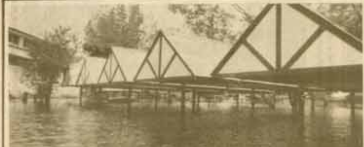
ที่ทัศนศึกษา ที่เห็นในภาพคือแบบที่ฝึกนักศึกษาซึ่งบริษัทเซนต์แห่ง ประเทศไทย จำกัด ได้บริจาคเงินให้มหาวิทยาลัยสร้างจำนวน 10 ชุม เป็นเงิน 3.5 ล้านบาท