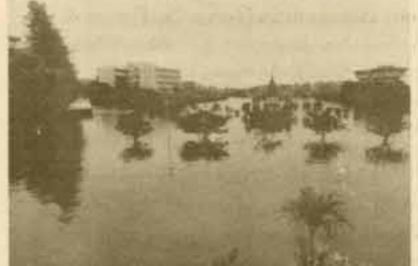
น้ำยังท่วม ภาพนี้ถ่ายเมื่อวันที่ 16 พ.ย. 26 นับเป็นเวลา 1 เดือนเต็มที่น้ำท่วมมหาวิทยาลัยรามคำแหงเป็นต้นมา แต่สภาพน้ำยังสูงอยู่ในระดับเดิม