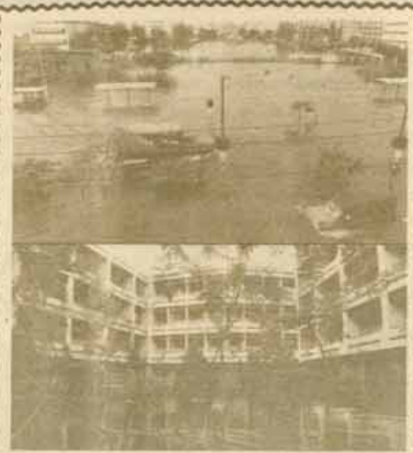
นอกจากใน ระดับน้ำภายนอกและภายใน ม.ร.ร.จะระดับเดียวกัน ที่เห็นภาพที่ถนนหน้ามหาวิทยาลัยและอาคารที่ปรากฏจะได้รับความเสียหาย

ผู้ประสงค์จะสมัครสอบ ขอใบสมัครสอบได้ที่ศูนย์ปัดนี้ เป็นต้นไป และยื่นใบสมัครสอบได้ที่บริเวณหน้าสำนักงานผู้ตรวจราชการกระทรวงมหาดไทย ภายในบริเวณกระทรวงมหาดไทย ถนนแจ้งวัฒนะ วันที่ 24 พฤศจิกายน - 18 ธันวาคม 2526 ในวันราชการ ภาคเช้า เวลา 08.30 - 11.45 น. และภาคบ่าย เวลา 13.00 - 16.00 น. (ผู้สมัครสอบจะต้องสำเร็จการศึกษาและได้รับอนุมัติปริญญาจากผู้มีอำนาจอนุมัติภายในวันเปิดรับสมัครสอบที่ถนัด วันที่ 16 ธันวาคม 2526) ผู้สมัครสอบจะต้องเสียค่าธรรมเนียมสอบ จำนวน 40 บาท และกรมการปกครองจะประกาศรายชื่อผู้มีสิทธิเข้าสอบให้ทราบล่วงหน้าก่อนวันสอบไม่น้อยกว่า 7 วัน