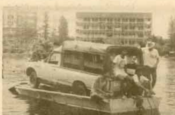
เรือกึ่งรถ กองอาคารสถานที่เริ่มดำเนินการขนย้ายรถยนต์เล็กของมหาวิทยาลัยที่จอดอยู่ภายในมหาวิทยาลัยออกไปภายนอก โดยถวารถกึ่งเรือท้องแบน เพื่อนำออกไปจอดให้ใช้การได้