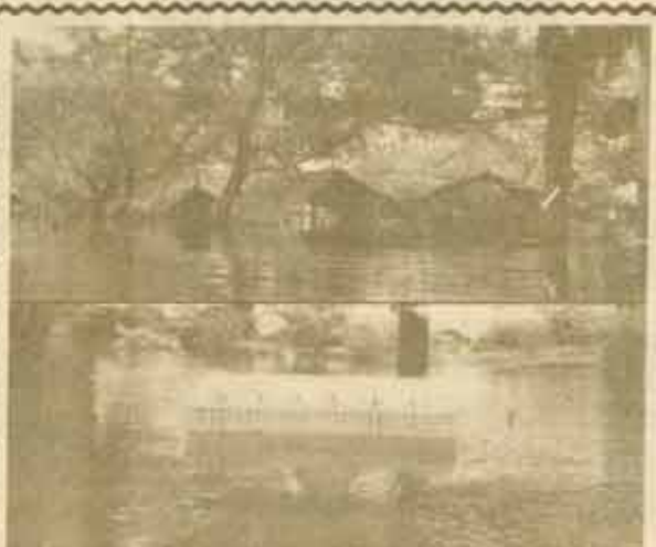
เด็บบาย เติงที่พิกัดศึกษาและผู้นำสัมพันธ์ ส่วนใหญ่ได้รับความเสียหายเพราะถูกน้ำท่วมจนเกือบมิด

สำหรับรายการพิเศษ วันสถาปนามหาวิทยาลัยครบรอบ 12 ปีนี้ จะกล่าวถึงความเป็นมาและความเจริญก้าวหน้าของมหาวิทยาลัยรามคำแหงในรอบ 12 ปีที่ผ่านมา และจะมีการอภิปรายในหัวข้อ "มองรามฯ" โดยบุคคลผู้ทรงคุณวุฒิในสาขาอาชีพต่าง ๆ ซึ่งจะมีใครร่วมอภิปรายบ้างนั้น "ข่าวรามคำแหง" จะเสนอความคืบหน้าให้ทราบต่อไป