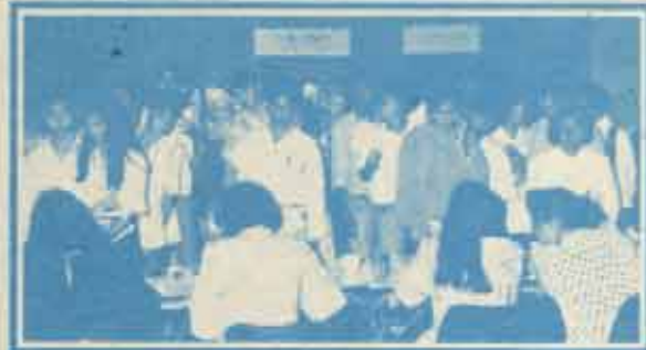
รับสมัครนักศึกษาใหม่ '37 ม.ร.กำลังรับสมัครนักศึกษาใหม่ชั้นปริญญาตรีของทั้ง 7 คณะ ประจำปีการศึกษา 2537 ไปจนกระทั่งถึงวันที่ 21 มิถุนายน 2537 ณ อาคารกีฬาเอนก (KLB) และอาคารเวียงคำ (VKB)

สำหรับยอดการจำหน่ายตั๋วในปีนี้สูงกว่าปีที่ผ่านมา ส่วนยอดจำหน่ายใบสมัครทางไปรษณีย์ 84 ชุด ด้วยยอด 2,460 ชุด