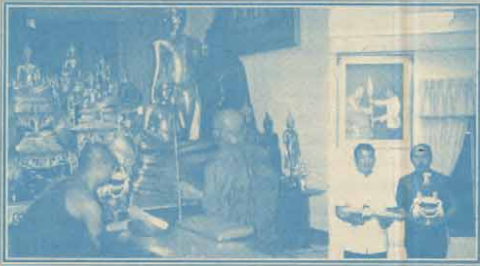
ประธานพระพุทธรูป สมเด็จพระญาณสังวร สมเด็จพระสังฆราช สกลมหาสังฆปริณายก ทรงประกอบพิธีเททองและพิธีมหาพุทธภิเษก พร้อมทั้งกลั่นฐานจิตและเททองพระเนตร และได้ประทานพระพุทธรูปให้แก่โรงเรียนสาธิตมหาวิทยาลัยรามคำแหง เพื่อเนรมิตเป็นพระพุทธรูปประจำโรงเรียน เมื่อวันที่ ๒๑ พฤษภาคม ๒๕๓๗ ณ วัดบวรนิเวศวิหาร