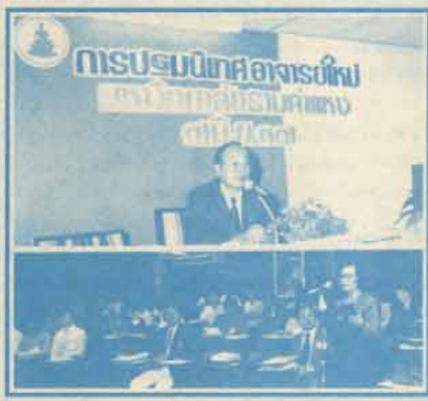
ประชุมเนืทศอจารย์ใหม่ รท.รังสรรค์ แสงสุข อธิการบดีมหาวิทยาลัยรามคำแหงเป็นประธานในการประชุมเนืทศอจารย์ใหม่ เมื่อวันที่ 7 มิถุนายน ๒๕๓๗ ณ ห้องประชุมบัณฑิตศึกษาคณะวิทยาศาสตร์ ชั้น 4

นายเนวิน ชิดชอบ ส.ส.บุรีรัมย์ พรรคชาติไทย ในฐานะโฆษกคณะกรรมการพิจารณาร่างรัฐธรรมนูญฉบับที่ฝ่ายค้านเสนอ แถลงที่รัฐสภาเมื่อวันที่ 6 มิถุนายน 2537 ว่าได้มีการลงมติประเด็นอายุของผู้มีสิทธิเลือกตั้งสมาชิกสภาผู้แทนราษฎรด้วยคะแนนเสียง ดังนี้ 1. ให้ผู้มีอายุ 20 ปีมีสิทธิเลือกตั้ง 13 เสียง 2. ให้ผู้มีอายุ 18 ปีมีสิทธิเลือกตั้ง 7 เสียง และ 3. มีกรรมาธิการที่งดออกเสียง 6 เสียง จากองค์ประชุมในวันดังกล่าวจำนวน 26 คน (องค์ประชุมที่รัฐสภาแต่งตั้งทั้งสิ้น 46 คน) อย่างไรก็ตามการต่อสู้ให้ได้น่าซึ่งสิทธิเลือกตั้งสมาชิกสภาผู้แทนราษฎรของผู้มีอายุไม่ต่ำกว่า 18 ปีบริบูรณ์ ขึ้นไปนั้น กรรมาธิการพิจารณาว่ารัฐธรรมนูญแห่งราชอาณาจักร (อ่านต่อหน้า 11)