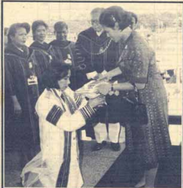
สมเด็จพระเทพรัตนราชสุดาฯ สยามบรมราชกุมารี เสด็จแทนพระองค์พระราชทานปริญญาบัตรแก่ผู้สำเร็จการศึกษาจากมหาวิทยาลัยรามคำแหง รุ่นที่ 18 ประจำปีการศึกษา 2534 ณ อาคารใหม่สวนอัมพร