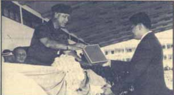
ในปีการศึกษา 2535 นี้ ศูนย์การฝึกกำลังสำรองกรมการรักษาดินแดน ได้พิจารณาให้มหาวิทยาลัยรามคำแหงได้รับรางวัลเป็นสถาบันดีเด่น 3 รายการ เมื่อวันที่ 20 พฤศจิกายน 2535 คือ อ่านต่อหน้า 12