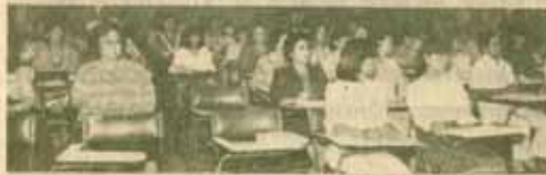
อบรมครู คณะเศรษฐศาสตร์ ม.ร. จัดอบรมความรู้ทางเศรษฐศาสตร์สำหรับผู้ที่สอนในระดับมัธยมศึกษาตอนปลายหรือเทียบเท่า เมื่อวันที่ 3-4 กรกฎาคม 2529 ณ ห้องประชุมคณะเศรษฐศาสตร์ ชั้น 4