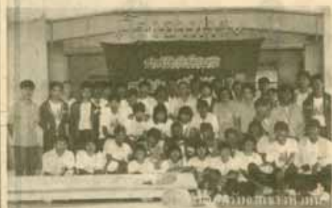
หน้าคณะมนุษยศาสตร์