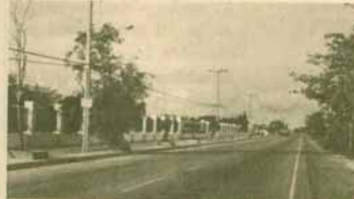
ไฟฟ้า แสดงสว่างสาธารณะหน้ารามฯ 2