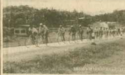
หน้าคณะมนุษยศาสตร์