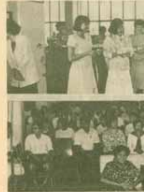
ฮอปที่ห้องสมุด ร.ศ.สุขุม นวดสกุล อธิการบดีมหาวิทยาลัยรามคำแหง เป็นประธานเปิดงาน "สัปดาห์ห้องสมุด" เมื่อวันที่ 14 กรกฎาคม 2529 ณ ฝ่ายห้องสมุดวิทยาสคร อธิการพระเมธ (PRB) รามคำแหง 2 ซึ่งสำนักหอสมุดกลาง ม.ร. เป็นผู้จัด เพื่อแนะปาวีการเรียน การใช้ห้องสมุดเพื่อการศึกษ และการใช้ชีวิตใน ม.ร. แก่นักศึกษาใหม่

กลุ่มที่ 1 วันจันทร์ - พุธ - ศุกร์ 17.00 - 19.30 น. กลุ่มที่ 2 วันอังคาร - พฤหัสบดี 17.00 - 19.30 น. และวันเสาร์ 09.00 - 11.30 น. ผู้สนใจเข้ารับการอบรมดังกล่าว ต้องมีพื้นฐานความรู้ ม.3 หรือเทียบเท่าขึ้นไป และมีความรู้ภาษาอังกฤษพอสมควร โดยจะรับผู้สนใจ