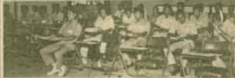
ฝึกอบรม คณะกรรมการดำเนินการพัฒนาและฝึกอบรมบุคลากร ของ ม.ร. และงานฝึกอบรม กองการเจ้าหน้าที่ จัดการฝึกอบรมหลักสูตรพนักงานขับรถ เมื่อวันที่ 16-17 กรกฎาคม 2529 ณ ห้องประชุมประมวล คุลมมาศย์