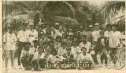
หน้าคณะมนุษยศาสตร์