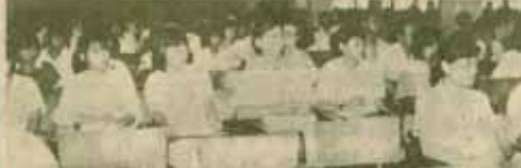
แนะนำคณะวิทยาศาสตร์ วิศวกรรมศาสตร์ ม.ร. เป็นประธานในการแนะนำคณะวิทยาศาสตร์บัณฑิตศึกษาใหม่ เมื่อวันที่ 10 กรกฎาคม 2529 ณ อาคารพระนาง (KIB) วนศ 2 เพื่อแนะนำหลักสูตรและวิธีการเรียนของนักศึกษาสาขาวิชาต่าง ๆ โดยคณาจารย์ของคณะฯ