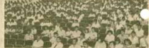
สัปดาห์เลือกตั้ง คณะวิทยาศาสตร์ ม.ร. จัด "สัปดาห์การอภิปรายและนิทรรศการทางวิชาการเกี่ยวกับการเลือกตั้งทั่วไป 2529" เมื่อวันที่ 14-18 กรกฎาคม 2529 ณ หอประชุม เอ.ค.1 โดยมีกรรมการอภิปรายและการจัดนิทรรศการ