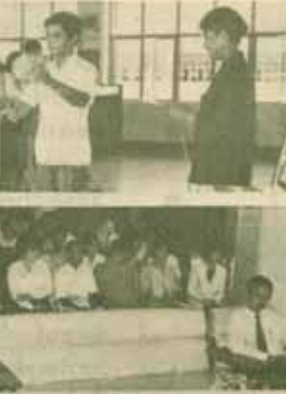
ฮอปที่ห้องสมุด ร.ศ.สุขุม นวดสกุล อธิการบดีมหาวิทยาลัยรามคำแหง เป็นประธานเปิดงาน "สัปดาห์ห้องสมุด" เมื่อวันที่ 14 กรกฎาคม 2529 ณ ฝ่ายห้องสมุดวิทยาสคร อธิการพระเมธ (PRB) รามคำแหง 2 ซึ่งสำนักหอสมุดกลาง ม.ร. เป็นผู้จัด เพื่อแนะปาวีการเรียน การใช้ห้องสมุดเพื่อการศึกษ และการใช้ชีวิตใน ม.ร. แก่นักศึกษาใหม่

นิเทศนักศึกษาใหม่ ปีการศึกษา 2529 ใน วันพฤหัสบดีที่ 24 กรกฎาคม 2529 เวลา 10.30 - 11.40 น. ณ อาคารคนที (KITB 201) รามฯ 2 การปฐมนิเทศครั้งนี้มีวัตถุประสงค์เพื่อให้คำแนะนำในการเลือกเรียนตามหลักสูตรในแผนต่างๆ การคิดค่าขอรับบริการด้านต่างๆ ตลอดจนการใช้ชีวิตในการเรียนในคณะวิทยาศาสตร์ โดยคณาจารย์และเจ้าหน้าที่คณะวิทยาศาสตร์ เป็นผู้แนะนำ