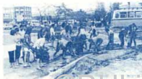
เจ้าหน้าที่ซ่อมทํานํ้าประปา ม.ว. และ ค.ศ. นอน