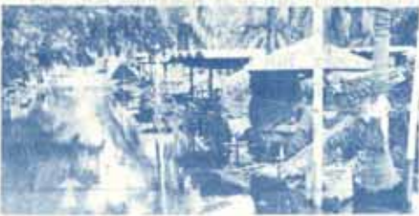
สภาพมหาวิทยาลัยหลังน้ำท่วม