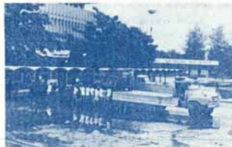
ทหารเรืออาสา จะนำหินเมื่อต้องการ