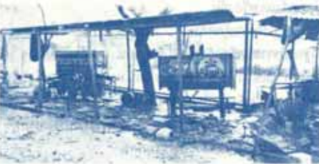
สภาพถนนและร้านอาหารชั่วคราวเมื่อน้ำลด