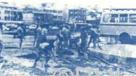
ภาพรวมกำลังขุดทรายบริเวณถนน