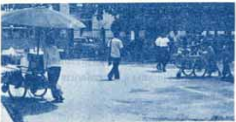
ภาพที่เห็นนี้คือภาพรถเข็นทาบเว่ผงลอยซึ่งมีอยู่เป็นร้อย ๆ คัน เข็นขายกันวันเวลายไปหมด เว่ร้อนไปทั่ว

ภาพที่เห็นนี้เป็นเพียงส่วนหนึ่งของร้านค้า ขายอาหารภายในมหาวิทยาลัย ซึ่งปลุกข้าวเขินเองอย่างไม่มีระเบียบ ขายก็เบงทางเท้า บางร้านก็เอาอ่างล้างถ้วยชามมาตั้งลังก์ข้างถนนเลย แลดูน่าเกลียดมาก สภาพแวดล้อมเช่นนี้มหาวิทยาลัยจะต้องแก้ไขและปรับปรุง ถึงแม้ว่าจะมีอุปสรรคที่ต้องเร่งดำเนินการดีกว่าปล่อยไว้จะกลายเป็นดินพอกหางหมู ในระยะนี้นับเป็นโอกาสดีของมหาวิทยาลัยเนื่องจากใกล้ทวรมหาวิทยาลัยปิด สิ่งสำคัญในการแก้ปัญหาที่นี่ที่มหาวิทยาลัยจะต้องจัดหาสถานที่ที่เหมาะสมไว้รองรับด้วย มิฉะนั้นจะมีปัญหาไม่สิ้นสุด อีกประการหนึ่งก็คือ จะต้องจัดให้กระจายและสมดุลกับคู่มือบริโภคนิยม เมื่อมหาวิทยาลัยจัดสถานที่ให้แล้วหากมีร้านค้าปลุกขึ้นโดยไม่ได้รับอนุญาต มหาวิทยาลัยก็ควรที่จะจัดการรื้อถอนทันที ในช่วงเวลาที่เอื้ออำนวย