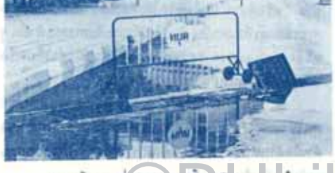
ภาพทั้งสองที่เห็นข้างบนนี้เป็นสถานที่ภายในมหาวิทยาลัยและผ้าที่ตระเวนขายที่หน้ามหาวิทยาลัย ซึ่งควรไป

แรมเดือนแรมปีก็ยังสภาพเช่นนี้ ไม่น่าเชื่อว่าผู้รับผิดชอบจะไม่ผ่านไปเห็นบ้างเลย ที่ท่านได้เห็นนี้เป็นเพียงส่วนหนึ่งเท่านั้น ยังมีอีกมากมายที่ได้หยิบยกขึ้นมาแล้ว เช่น นำก็อกไหลไม่หยุด ท่อระบายน้ำอุดตัน ห้องส้วมไม่สะอาด เหล่านี้เป็นต้น ถ้าหากมหาวิทยาลัยมีเจ้าหน้าที่คอยสอดส่องไม่เพียงพอ ก็น่าจะจัดกองรับค่าวีรกรรมเรียนไว้ มหาวิทยาลัยจะได้ทราบปัญหาและแก้ไขได้เร็วขึ้น