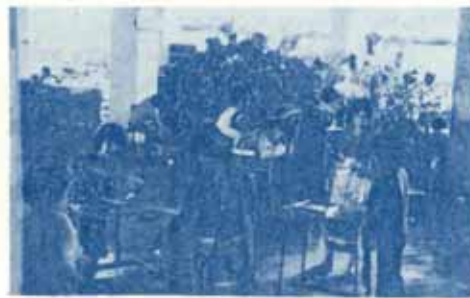
เจ้าหน้าที่มหาวิทยาลัยกำลังเร่งซ่อมเก้าอี้บรรณานุกรม