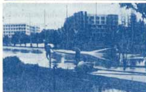
เจ้าหน้าที่ น.ร. ร่วมกับอาสาสมัครช่วยกันขุดลอกที่ท่าหมาก กำลังขุดน้ำท่าถนน